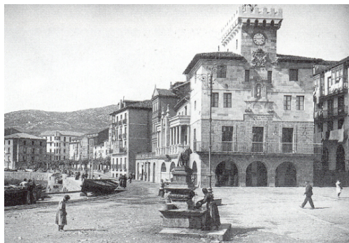
Ayuntamiento de Castro Urdiales antes y después de la reforma contemporánea.