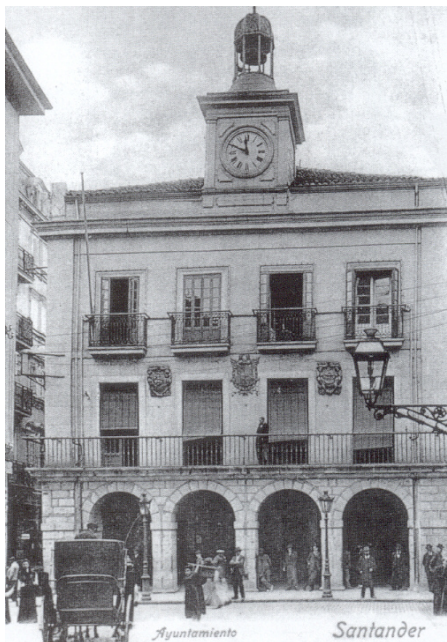
Ayuntamiento de Santander a comienzos del siglo XX.

solares y casas adquiridas para levantar el consistorio se edificó o utilizó una construcción, de manera eventual; esto explicaría por qué en 1572 se citan unas casas situadas en el cantón de la Plaza que afrontaban con las del consistorio. En 1627 el concejo ordenó cerrar la sala en la que se hacía regimiento mientras se finalizaba la nueva obra, por no encontrarse en buen estado. 241 En 1638 Francisco de Toca el mozo se obligó a fabricar la panadería en las nuevas casas de ayuntamiento, por lo que deducimos que el Ayuntamiento se estaba finalizando entonces.