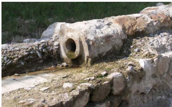
Caños de piedra de la traída de aguas recuperada en Castro Urdiales.

siglo XV y a una Real Ejecutoria de la Chancillería de Valladolid. 218 A partir de entonces, desde el arca de la puerta de San Francisco se repartió el agua a este convento y al de San Francisco.