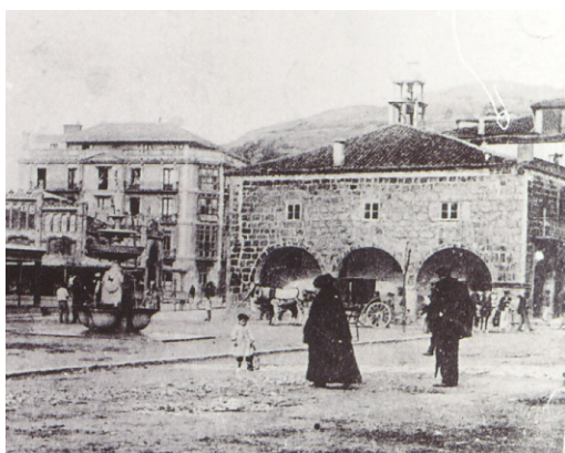
Ayuntamiento de Laredo y Plaza de Cachupín

El ayuntamiento de Laredo es un edificio renacentista de dos plantas, cuya fachada principal, abierta a la Plaza, se articula mediante dos galerías de arcos carpaneles de tradición tardogótica, apoyados en columnas cuyos capiteles destacan por su esquematismo. En las fachadas laterales también se abrieron arcos en el piso bajo, aunque se utilizan arcos de medio punto. Miguel Ángel Aramburu y Begoña Alonso señalan la influencia de la arquitectura burgalesa renacentista en este edificio, en concreto de algunos palacios, como el de los Condestables o el de Saldueña, en Sarracín, y de los arcos carpaneles del patio del colegio de San Nicolás de la ciudad de Burgos. 255