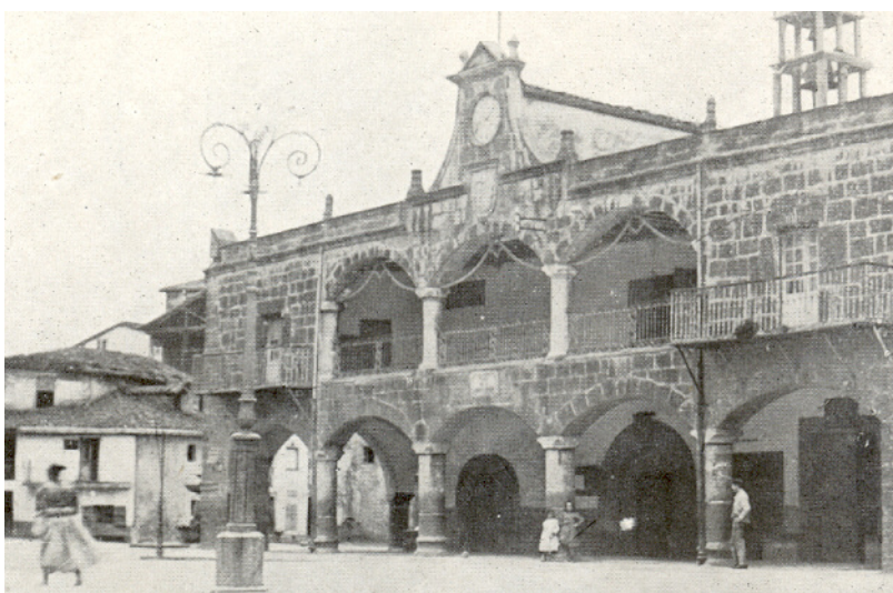
Ayuntamiento de Laredo a finales del siglo XIX.