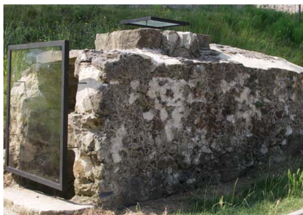
Arcas de la traída de aguas recuperada en Castro Urdiales.