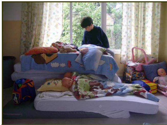
Los colchonetas son también recursos utilizados para jugar