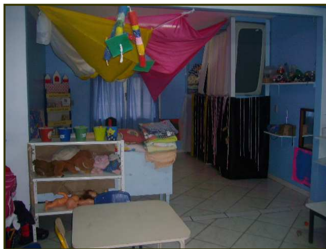
Uso de materiales desechos

En el CEI número (4), también con espacio de aula limitado, la profesora hace uso de materiales diversos y alternativos, organizando los espacios para mejor desarrollo de los niños y niñas pequeños: