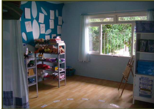
Espacio pequeño y bien aprovechado

También fue posible observar organizaciones de aula con otras características, como en el CEI número (3). Vemos que en un espacio tan pequeño, es visible el aprovechamiento y uso de la creatividad en cada rincón: