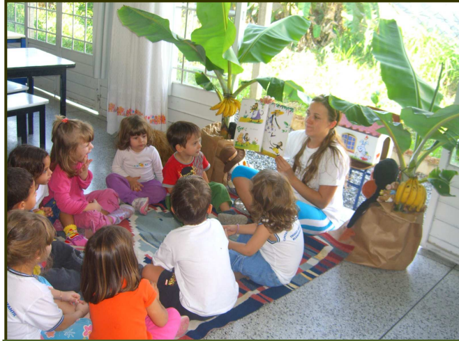
La profesora hace la lectura de un cuento y prepara el escenario de acuerdo con el tema de la historia

Seguimos con dos CEIs más, el número (5) y número (6), donde las profesoras presentan una gran creatividad e innovación, utilizando recursos materiales del propio espacio o de la naturaleza: