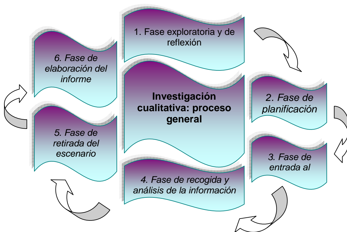
Fig. No. 16 Fases del Proceso General (Tomado de Praun, 2005:159, adaptado por la autora)

En la investigación cualitativa, refleja, describe e interpreta la realidad educativa con el fin de llegar a la comprensión o a la transformación de esa realidad, a partir del significado atribuido por las personas que forman parte de esta realidad. Esto supone que el investigador debe convivir, aproximarse y relacionarse con estas personas, pudiendo existir muchas verdades por descubrir.