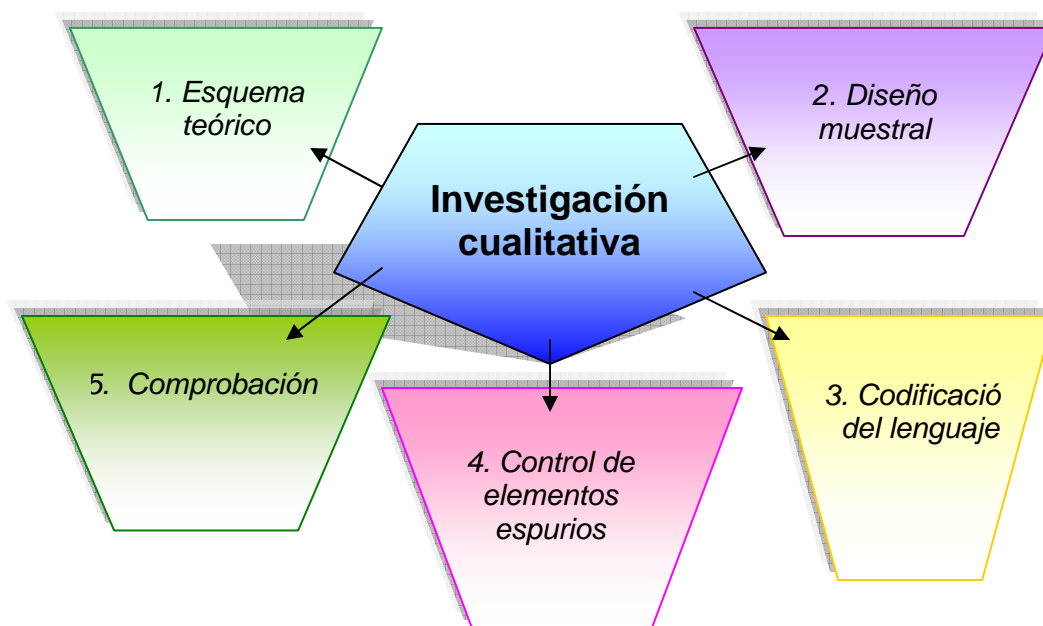
Fig. No. 15 Investigación Cualitativa (Tomado de Praun, 2005:157, adaptado por la autora)

La investigación cualitativa brinda un trato holístico a los fenómenos. La comprensión de los fenómenos desde una visión holística requiere considerar los contextos variados: temporales y espaciales, históricos, políticos, económicos, culturales, sociales y personales.