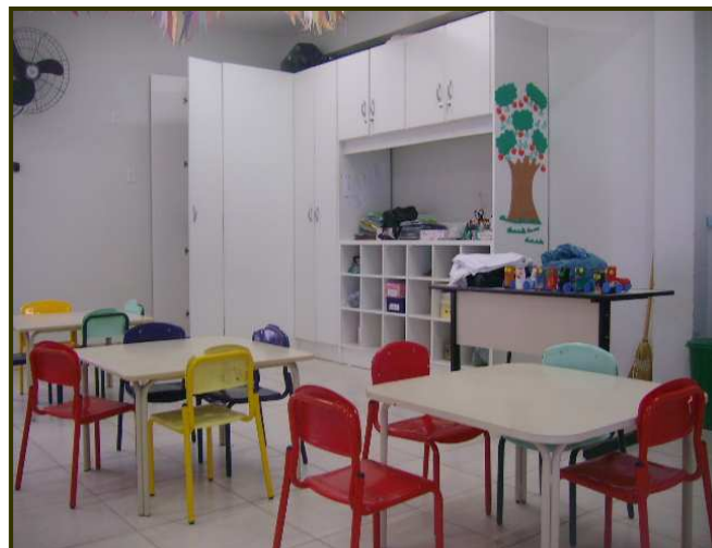
Aula de Maternal organizada con mesas y sillas

En la foto del CEI número (2), observamos que la organización es similar al CEI número 1. Además de poco espacio para jugar. ¿Como se organiza el espacio para que el niño o la niña pueda jugar, fantasear, crear y reinventar?