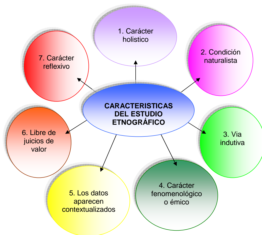
Fig. No. 19 Estudio Etnográfico: características (Tomado de Praun, 2005:164, adaptado por la autora)

Llevamos a cabo un estudio etnográfico de esa realidad por las razones que mencionamos anteriormente. También, nos interesó esta especialidad por una inquietud personal, y para formar parte de la realidad estudiada. Contribuyó