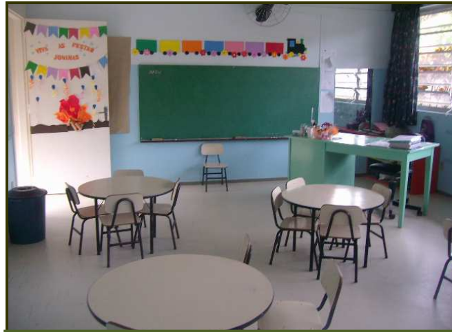
Aula de Jardim organizada con mesas y sillas

aula está lleno de mesas y sillas. ¿Cómo se tiene en cuenta la autonomía del niño en el momento de recoger juguetes y juegos?