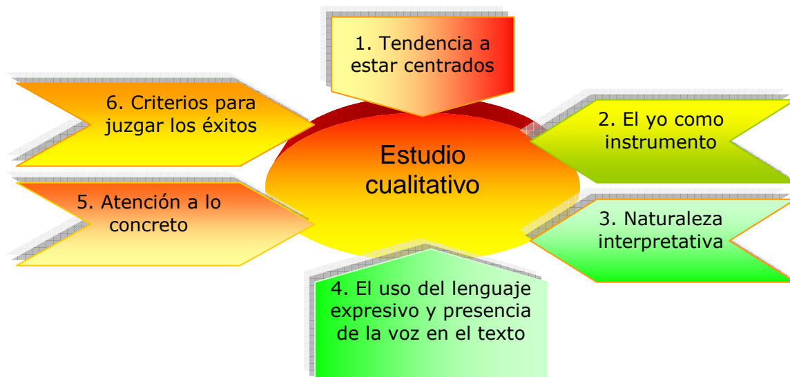
Fig. No. 14 Estudio Cualitativo: características (Tomado de Praun, 2005:154, adaptado por la autora)