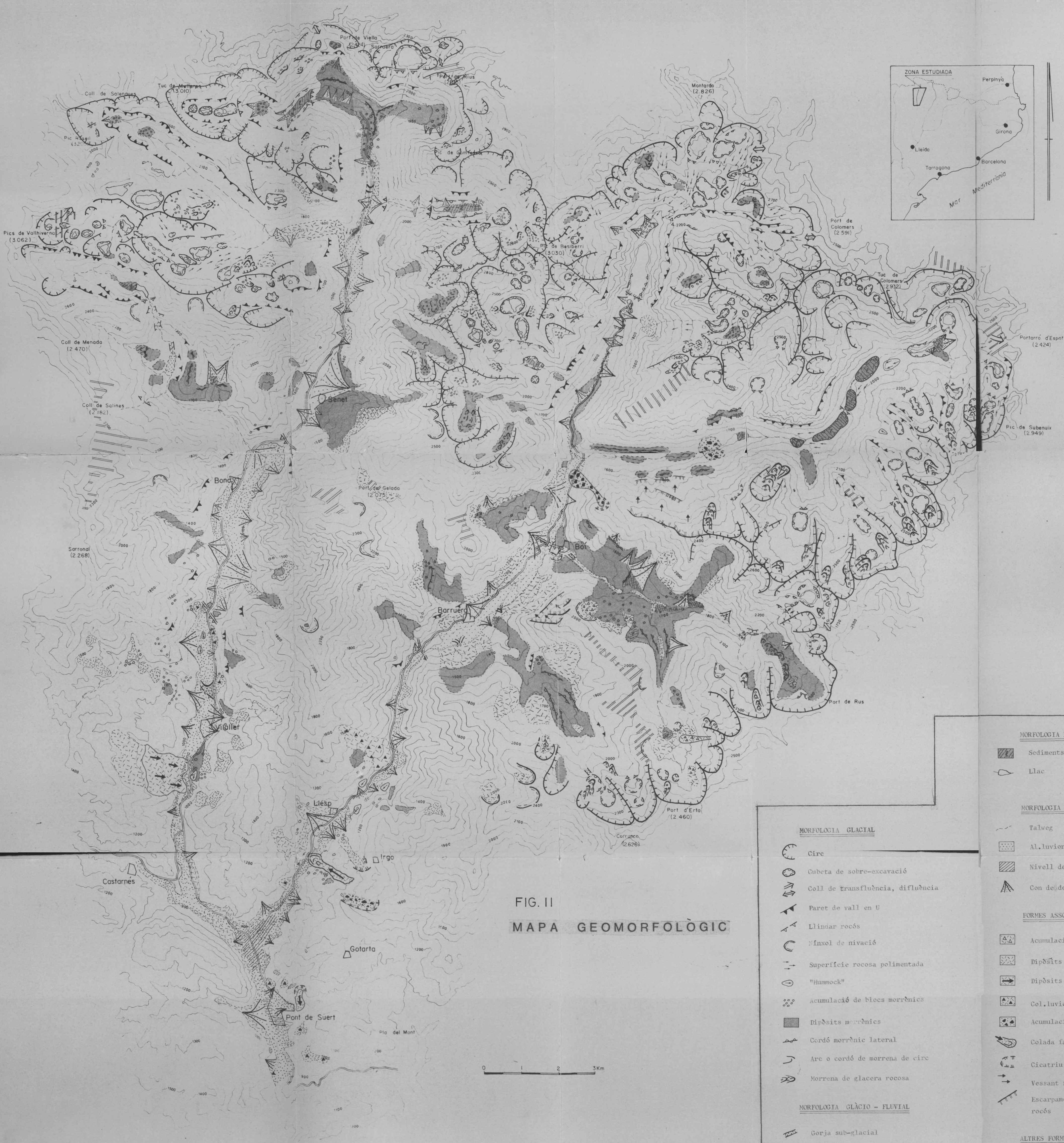
FIG. II MAPA GEOMORFOLÒGIC