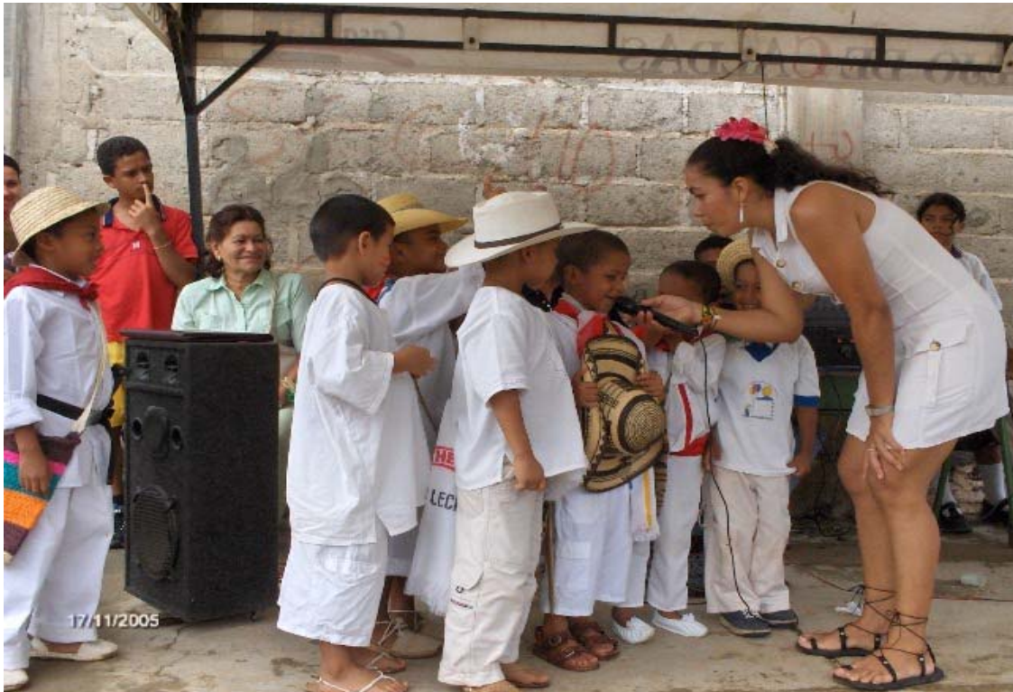
Figura 5. Actuación niños/as de preescolar – semana intercultural I.E.D. Nicolás Buenaventura

El profesorado muestra un alto nivel de implicación en el proceso del programa cuando participa en la planificación de la Semana Intercultural. No solo participó el profesorado participante conformado por 16 miembros, sino todo el claustro, es decir los 25 de la jornada de la tarde. Es más se extendió al profesorado de preescolar y básica primaria de la jornada de la mañana. Toda la comunidad educativa de la I.E.D Nicolás Buenaventura se organizó para llevar a cabo este evento.