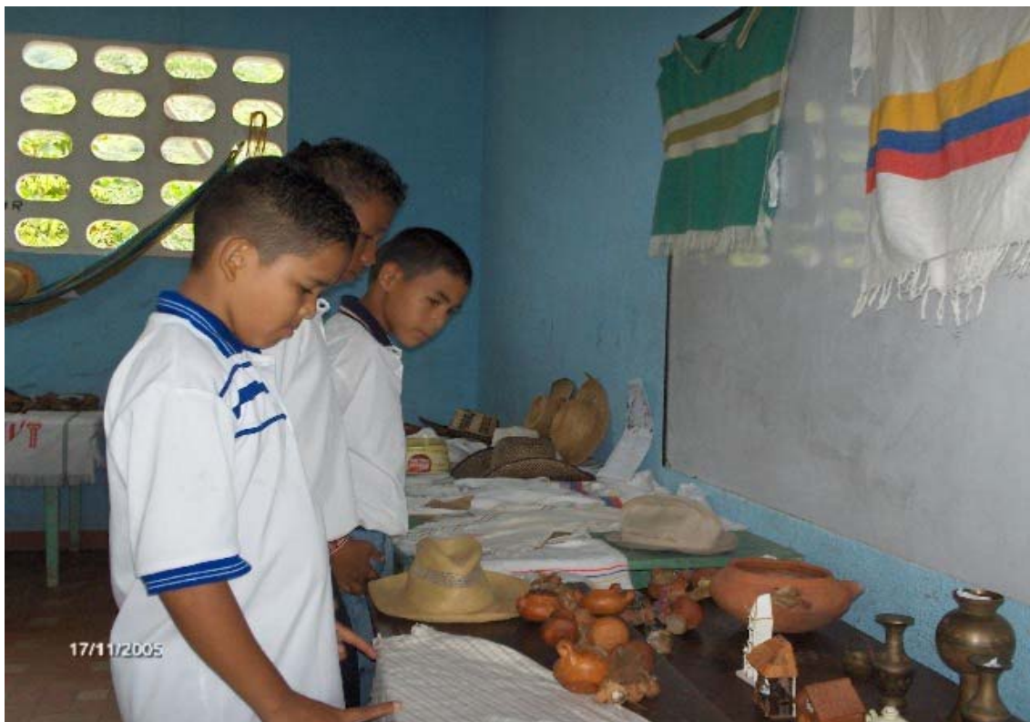
Figura 9. Museo étnico organizado por el alumnado de 8° grado I.E.D. Nicolás Buenaventura