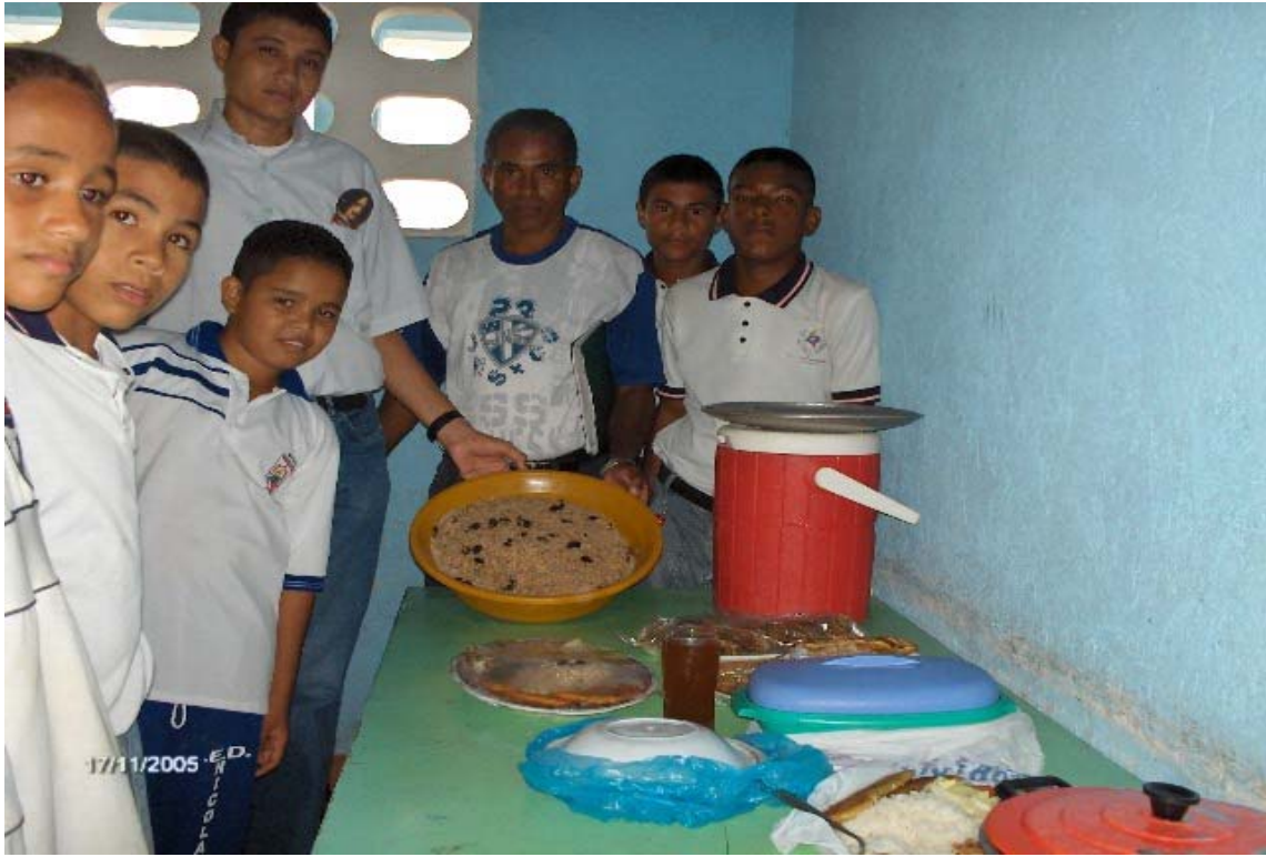
Figura 10. Gastronomía organizada por el grado 9°. I.E.D. Nicolás Buenaventura