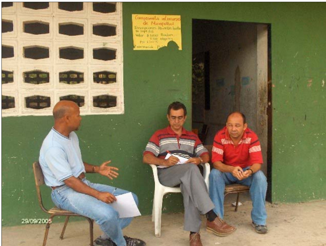
Figura 1. Uno de los grupos reflexivos del profesorado participante de la I.E.D. Cristo Rey

La implicación de un profesor/a en esta actividad en particular se observa, en la medida que analiza y reflexiona el problema del desplazamiento de la población en Colombia 194 , mediante talleres prácticos, basados en la vida real, en hechos comunes y silvestres, sin perder acento conceptual en la temática que se aborda, estos aspectos, fomentaron compromiso con la actividad en el profesorado, expectativas, que servía para algo en la institución educativa, además, hubo un clima jovial (bromas, chistes, etc.), y se mantenía la profundización de la temática.