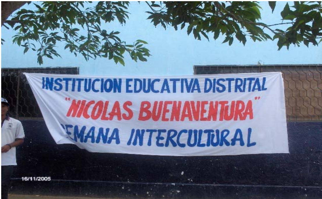
Figura 3. Pancarta de difusión de la semana intercultural en la I.E.D. Nicolás Buenaventura