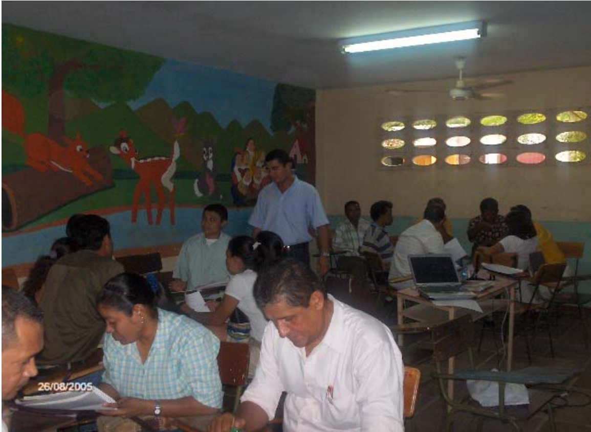
Figura 2. El profesorado de la I.E.D. Nicolás Buenaventura organizado en grupos reflexivos en una actividad

labor docente tiene mucho que aportar. Esa es una de las estrategias más relevantes en la formación permanente del profesorado en contextos de población vulnerable y diversa, tal como aparece en la figura 2.