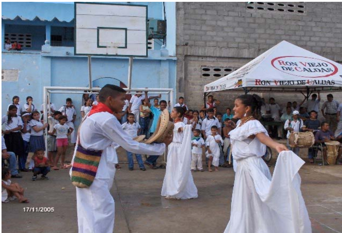
Figura 6. Danza de la cumbia, alumnado de 10º - semana – intercultural I.E.D. Nicolás Buenaventura