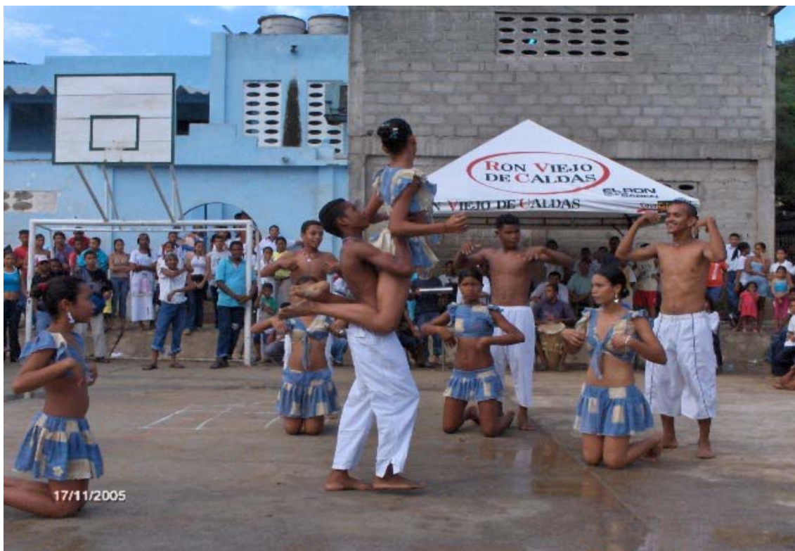
Figura 7. Danza del mapalé (ritmo afrocolombiano) presentada por el alumnado de 10º y 11º, I.E.D. Nicolás Buenaventura