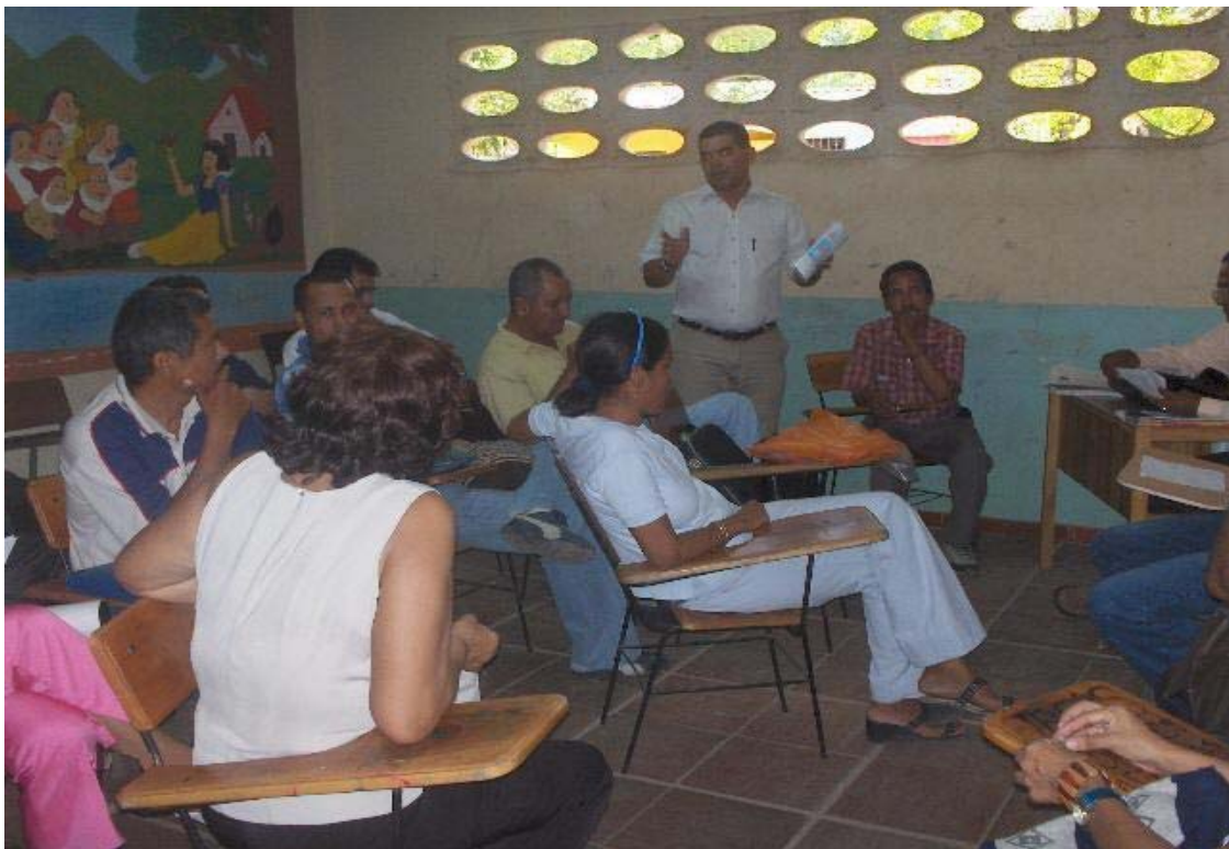
Figura 4. Reunión de planificación del profesorado de la Semana Intercultural en la I.E.D. Nicolás Buenaventura