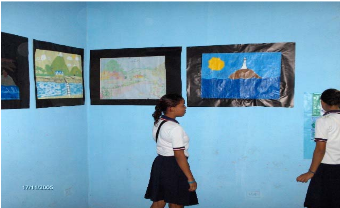
Figura 11. Pintura alusiva a la región caribe colombiana presentada por alumnado de diferentes grados de la I.E.D. Nicolás Buenaventura