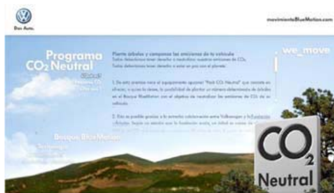
Figura 2. Anuncio de una marca de automóviles, utilizado en otras actividades de lectura crítica. Puede verse en: www.movimientoBlueMotion.com