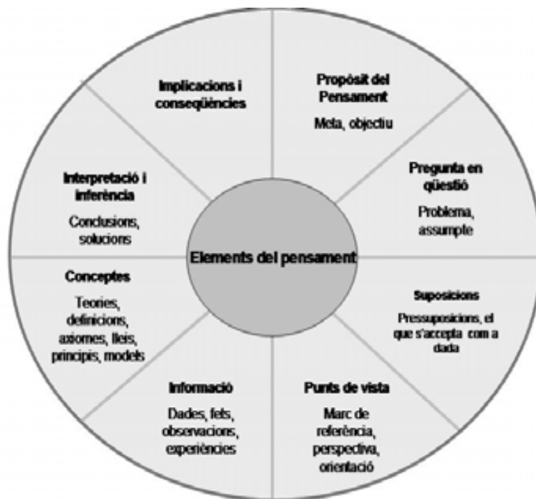
Figura 1. Elements de pensament, segons Paul i Elder (2006) 15