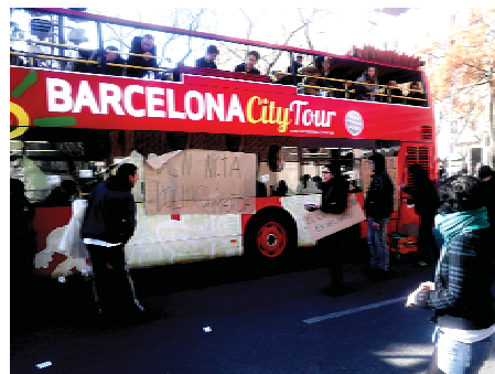
Figura 40. Fotografia d'una manifestació d'un grup llibertari davant la massificació turística a la Sagrada Família.

"Marca Barcelona, marca que significa exclusió, destrucció, mercantilització...una marca que com totes les marques ha de ser un objectiu a batre 269 ".