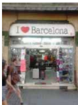
Figura 37. Establiments de souvenirs i restauració a les Rambles i a l'entorn de la Sagrada Família.

Aquests fenòmens provoquen percepció d'amenaça a la identitat d'alguns barris i veïnats que resistiran per preservar els seus estils de vida, edificis, espais històrics i llurs usos socioculturals i comercials . S'aguditzava la tensió mundialització-identitat en el marc de l'empobriment de la classe treballadora i mitjana, i la protesta dels sectors ciutadans locals no beneficiaris de l'economia turística, corporativa o financera. El turisme, com a fenomen derivat de la globalització, sinó és polititzat i gestionat (Subirats, 2008) esdevé urbanitzador.