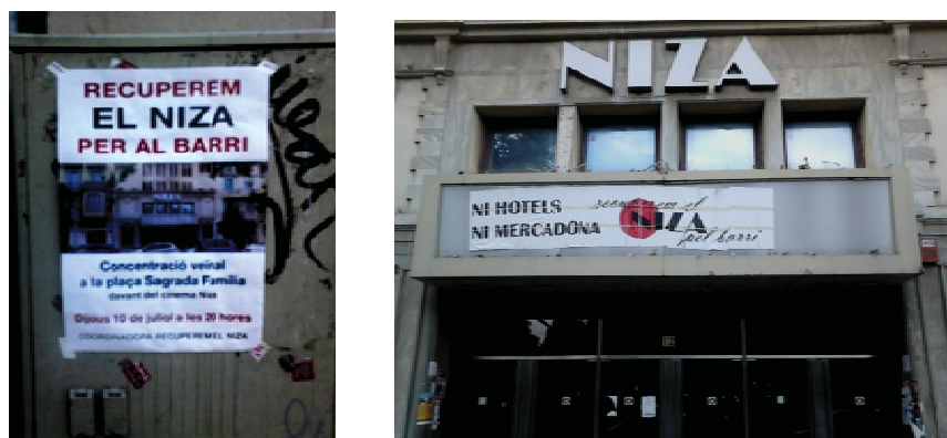
Figura núm. 36. Cartell de mobilització veïnal per preservar l'ús ciutadà del cinema Niza a la Sagrada Família.