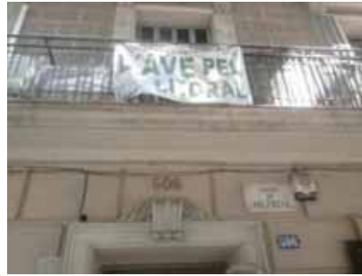
Figura núm. 38. Fotografia. Protesta veïnal al barri de la Sagrada Família pel temor d'afectació del túnel del Tren d'Alta Velocitat.