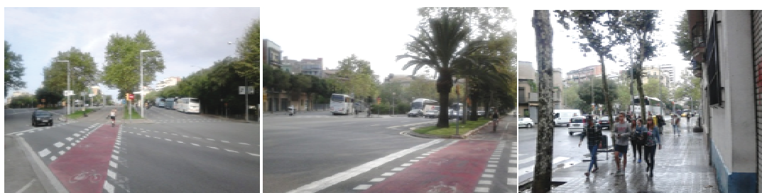
Figura 39. Àrees d'estacionament d'autocars a l'avda. Diagonal, pl. de la Hispanitat i pl. de Pablo Neruda per evitar la congestió a la Sagrada Família.

Aquest fet influirà en la qualitat de vida quotidiana a les àrees centrals i turístiques (Ciutat Vella, Raval, Barceloneta, Sagrada Família, Park Güell, etc.) on apareixeran queixes respecte el soroll, la congestió del trànsit, l'incivisme i la inseguretat viària i ciutadana 264 :