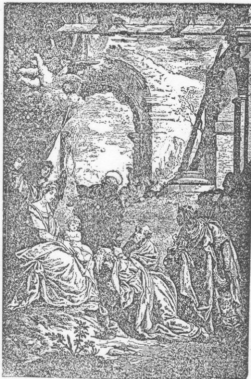
La adoración de los Santos Reyes

Día 8, Sábado.—Stos. Luciano, ob. y mr.; Maximiliano, Julián, Eugenio, Teófilo y Eladio, mrs.; Apolinar, Severino, Máximo, Paciente y Aldrico, obs. y cfs.—Sta. Gudula, vg.