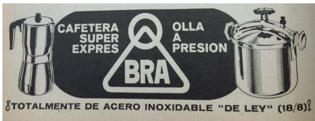
IMATGE 20: Anunci de la «Hoja Dominical» al n. 1 del 4/01/1970, pàgina interior.

La publicitat, en aquests anys, ve a ser la de sempre, destaca l'anunci de l'olla a pressió ( Imatge 20 ), que era criticat per la Ponència dels deu capellans barcelonins que hem analitzat en el capítol anterior. Creiem que val la pena reproduir-lo: