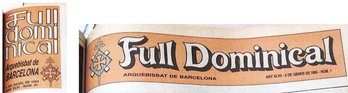
IMATGE 21: Capçaleres de 1984 i 1985.

I com havia estat habitual en altres moments, sense cap avís previ ni cap explicació en el moment del canvi, el primer número de l'any 1985 927 presenta una capçalera completament transformada ( Imatge 21 ). Com podem apreciar, el canvi és significatiu, però no del tot reeixit. Aquesta capçalera perdurarà fins al mes de març de 1991 i el sistema d'un color setmanal es manté.