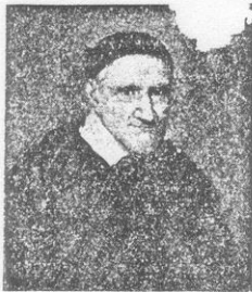
Sant Vicenç de Paül.

Dia 19 ✠ Diumenge VII després de Pentecosta.—Sant Vicenç de Paül, fdr. i Santes Justa i Rufina.