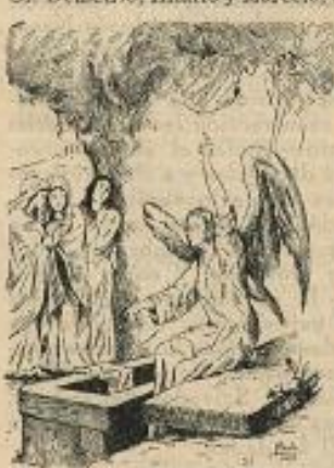
Resurrección del Señor.

Día 9 ✠ Domingo. — Pascua de Resurrección. Ss. Demetrio, Hilario y Marcelo; Sta. María Cleofé.