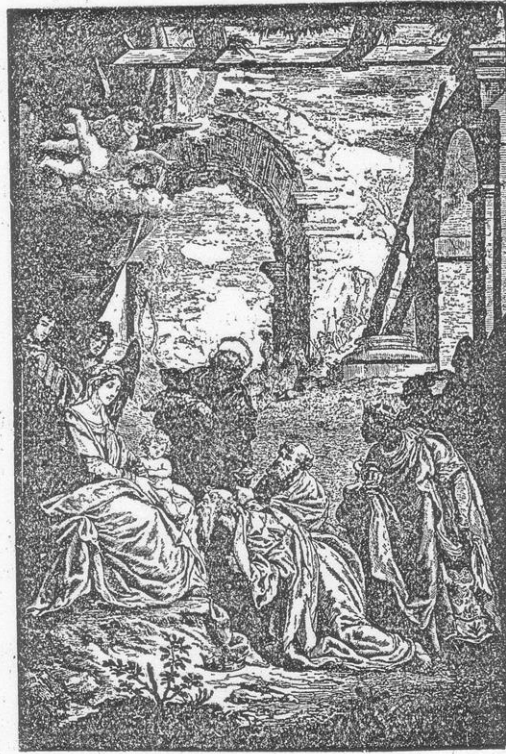
L'ADORACIÓ DELS SANTS REYS

Día 8, Dissapte.—Sants Lluciá, b. y mr.; Maximiliá, Juliá, Eugeniá, Teófil y Eladi, mrs.; Apolinar, Severi, Máxim, Pacient y Aldrich, bs. y cfs.—Sta. Gudula, vg.