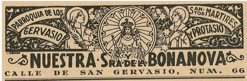
IMATGE 16: Capçalera de la parroquia de Nostra Senyora de la Bonanova a la contraportada del n. 2 de la «hoja diocesana».

Com ja hem dit, a partir d'aquest segon número cada parròquia recupera la contraportada del full per als seus avisos, horaris de misses, de despatx parroquial, de confessions i per a publicar-hi petites notícies. Algunes parròquies tenien fins i tot la seva capçalera a la contraportada, ben dissenyada, segons l'època ( Imatge 16 ).