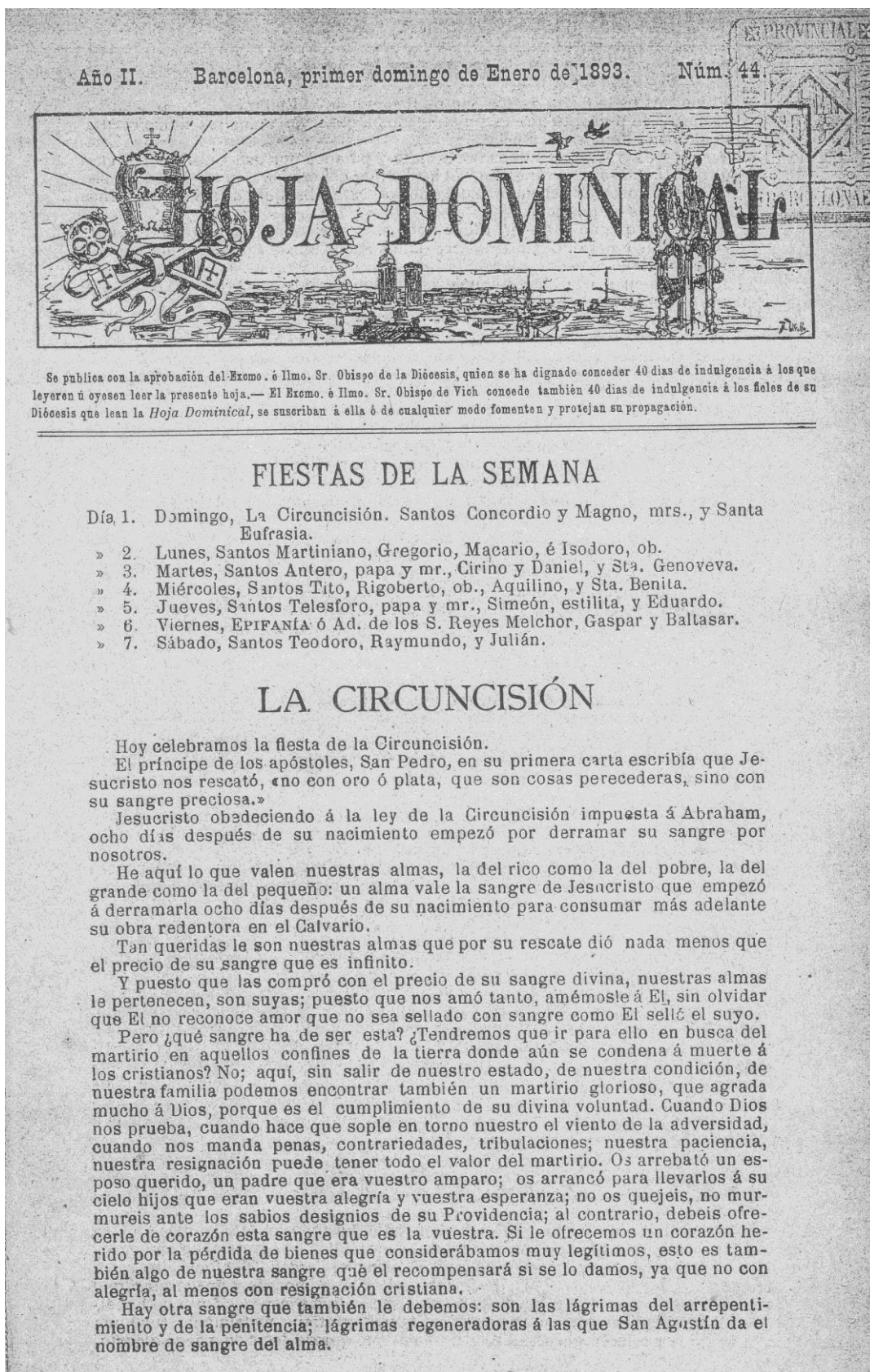
IMATGE 2: «Hoja Dominical» de 1893, any II de la seva publicació.