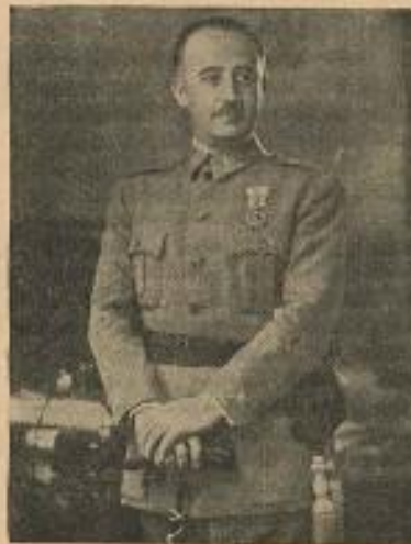
S. E. el Jefe del Estado Español, D. Francisco Franco Bahamonde. Insiste Generalísimo de los ejércitos del Aire, Mar y Tierra, Jefe Supremo de la Santa Cruzada que ha devuelto a España la santa libertad y la paz.