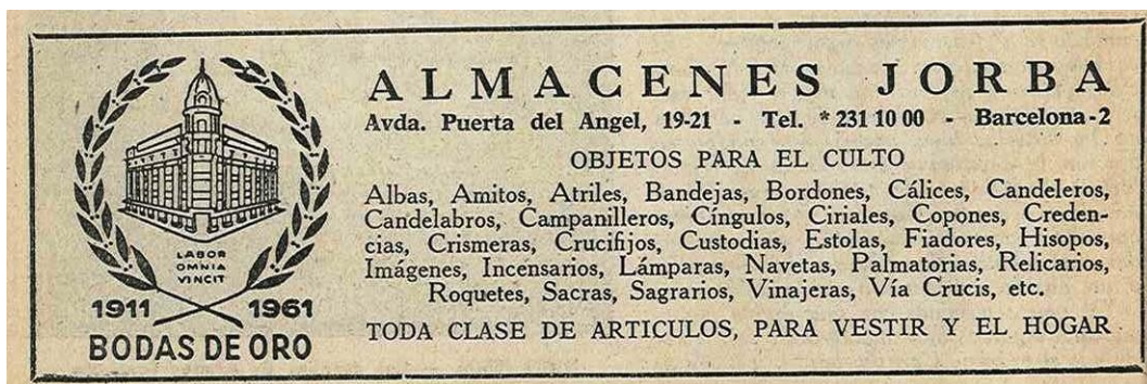
IMATGE 17: Publicitat dels coneguts Almacenes Jorba de Barcelona a la « Hoja Diocesana » n. 3 del 21/01/1962, pàg. 34.

requadre, publicacions religioses de la mateixa Associació d'Eclesiàstics per a l'Apostolat Popular. Després, l'any 1958 i fins al darrer número de 1977, vindran anuncis publicitaris de tota mena i de qualsevol cosa: magatzems de roba, col·legis, rellotgeries, joieries, llibres, roba per a capellans ( Imatge 17 ), art litúrgic, medicaments, assegurances, representacions teatrals i fins i tot, un restaurant xinès, « El gran dragón » al carrer Ciutat, 5, entre d'altres. Tot un seguit d'ofertes ben variades pensades per als fidels catòlics. La publicitat era una manera d'ajudar al sosteniment de la Hoja , una idea, que amb els anys va desaparèixer, per retornar a un full només de formació i informació.