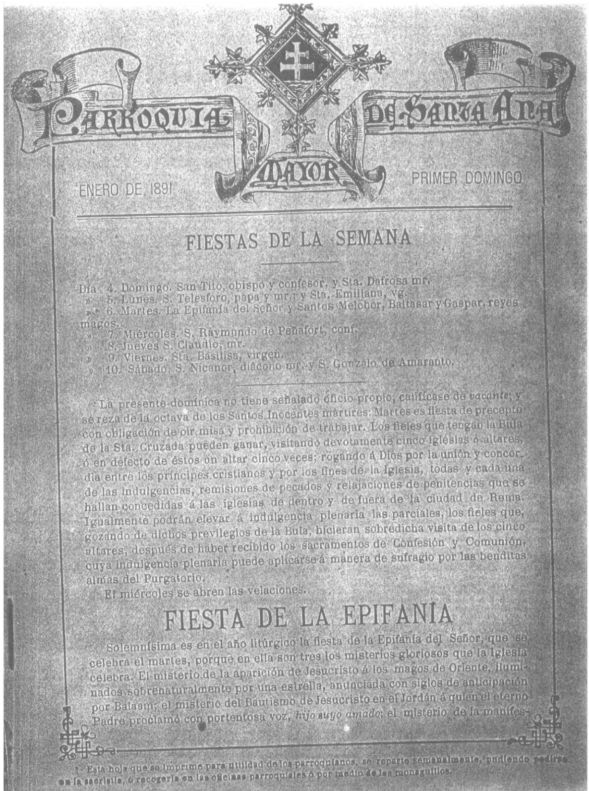
IMATGE 1: «Hoja Parroquial de Santa Ana», primer número de 1891.