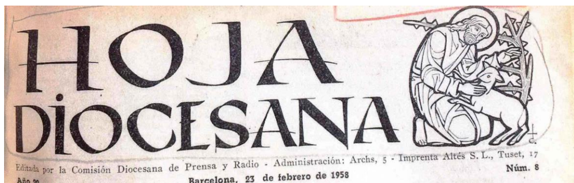
IMATGE 19: Capçalera de la «Hoja Diocesana» n. 8 del 23/02/1958, pàg. 57.