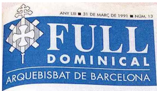
IMATGE 22: Nova capçalera de l'any 1991, es mantindrà sense gaires canvis fins a finals de l'any 2012.

A la primera pàgina: una foto-notícia, el pensament del bisbe o un editorial. La segona pàgina és litúrgica: inclou, en català i en castellà, les lectures de la missa dominical i altres textos litúrgics. La tercera és una pàgina de relació de la litúrgia i la vida. La quarta pàgina inclou informacions: a les dues columnes de l'inici de pàgina, temes d'interès general o interdiocesà (en l'edició per a Barcelona hi ha en aquest espai la "Carta Dominical" del Sr. Arquebisbe). A les dues columnes de la dreta hi van les informacions i notícies pròpies de cada bisbat. -La Redacció. 960