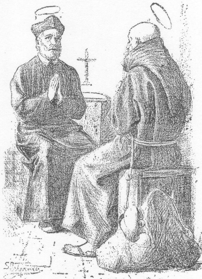
San Felipe Neri conversando con San Félix de Cantalicio.

Día 29, Domingo ✠ II después de Pentecostés. — Santos Máximo y Maximino, obs y cfs; Eleuterio, cf.; Voto y Félix, cfs, en Zaragoza; Restituto, mr. — Sta. Teodosia, mr.