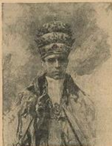
S. S. Pío XII Jefe supremo de la Iglesia Católica, Padre de los príncipes y de los reyes, Vicario de Dios, Señor Jesucristo Príncipe de la Paz.

Día 16 ☿ Domingo.—De Quasimodo o de Albis .—Sa. Toribio y Fructuoso. Día 17. Lunes.—Sa. Amato y Rodulfo. Día 18. Martes.—Sa. Eleuterio y Perfecto. Día 19. Miércoles.—Sa. Hermógenes, Expedito y Rufo. Día 20. Jueves.—Sa. Teótimo, Sulpicio y Cesario. Día 21. Viernes.—Sa. Anselmo y Silvio. Día 22. Sábado.—Sa. Estero y Cayo. Día 23 ☿ Domingo.—II después de Pascua. La Divina Pastora. Sa. Jorge y Adalberto.