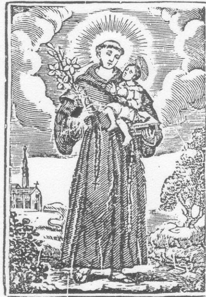
Sant Antoni de Pàdua.

La Missa d'avui, 9 de juny, és de la Dominica III de Pentecosta (EUCOLOG, pàg. 314). Color verd. La del diumenge vinent, a la pàg. 318.