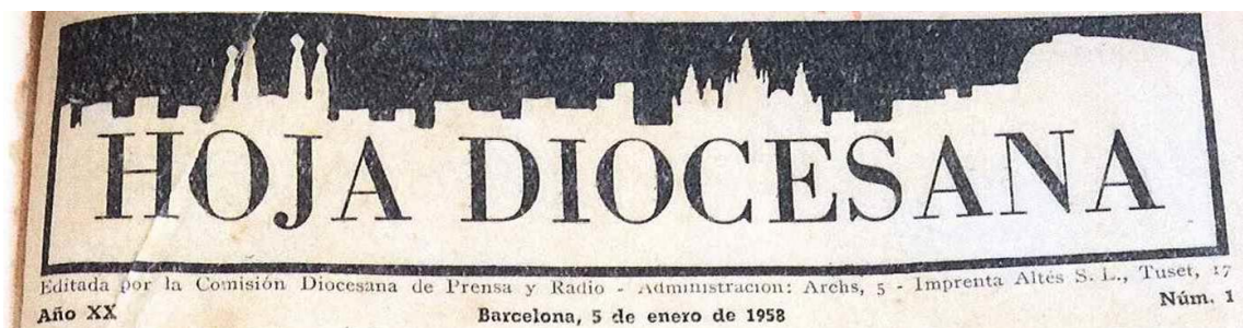
IMATGE 18: Capçalera de la «Hoja Diocesana» n. 1 del 05/01/1958, pàg. 1.

També el 1958 és un any de ball de capçaleres i d'impressors en un esforç de voler renovar-se però amb una variabilitat que crida l'atenció. Aquest primer número té una capçalera destacable per la seva modernitat, perquè darrere del nom es retalla la silueta de Barcelona amb la Sagrada Família i la catedral ( Imatge 18 ), tot i que aquesta només va sortir en aquest número i en el número 4. En el número 2 i 3 surten dues capçaleres ben diferents. En el número 5, semblant a la 2, i el 6 i el 7, igual que el número 3. No serà fins al número 8 ( Imatge 19 ) quan es publicarà amb una capçalera fixa, molt senzilla, on al costat del nom de Hoja Diocesana , cada setmana hi ha un petit dibuix diferent. Aquest sistema de capçalera s'allargarà fins al primer número de l'any 1964.