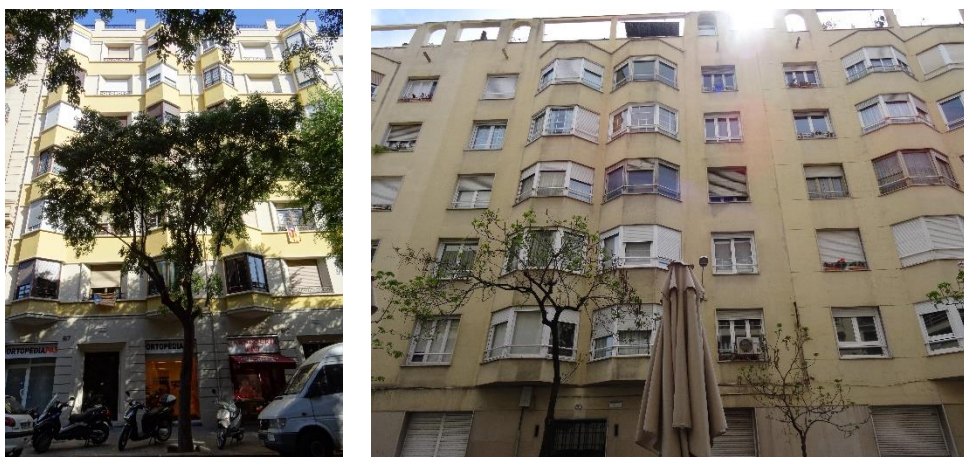
Fig. 302. Tribunas o "bow windows" en las fachadas de la "Nueva Arquitectura".

Dentro de todo el repertorio que encontramos y analizamos en la tesis, pudimos ver que otro de los elementos constantes en esta "Nueva Arquitectura": la utilización de tribunas como elemento importante y característico en parte de la composición de estas fachadas.