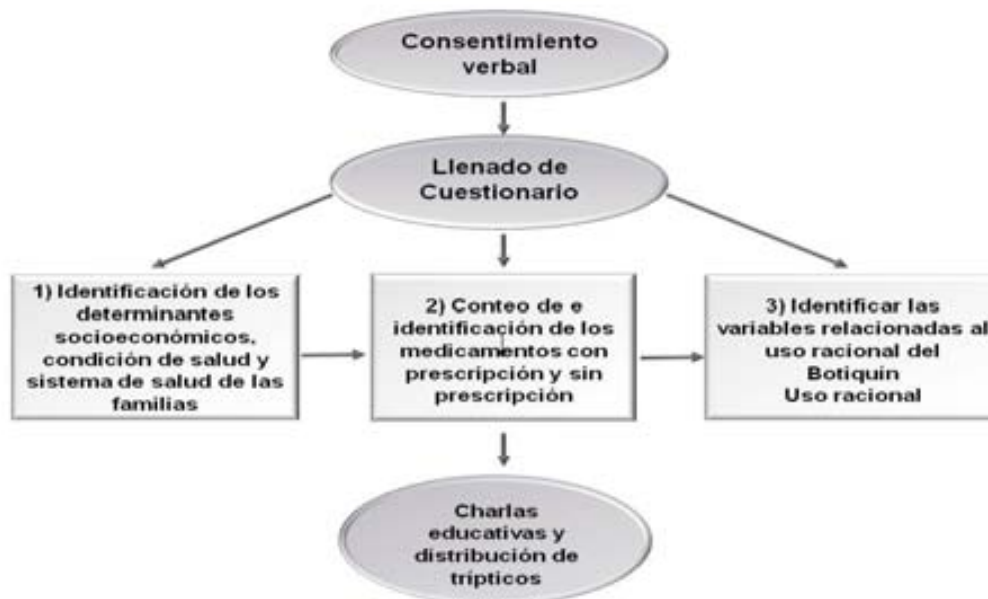
Figura 4. Esquema de trabajo aplicado para la recolección de datos e información a la comunidad

El entrevistador notificaba al entrevistado el objetivo del estudio y sus fines, siguiendo el siguiente esquema. (Figura 4 y Anexos 2 y 3)