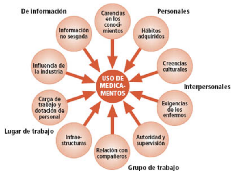
Figura 1. Algunos factores que influyen en el uso de medicamentos

Un enfoque que busca explicar los determinantes que se relacionan con el consumo y uso de los medicamentos está basado en aspectos conductuales actitudinales, creencias y conocimientos adquiridos producto de la interacción del individuo con su entorno. (60) Tal como en representando en la siguiente figura 1: