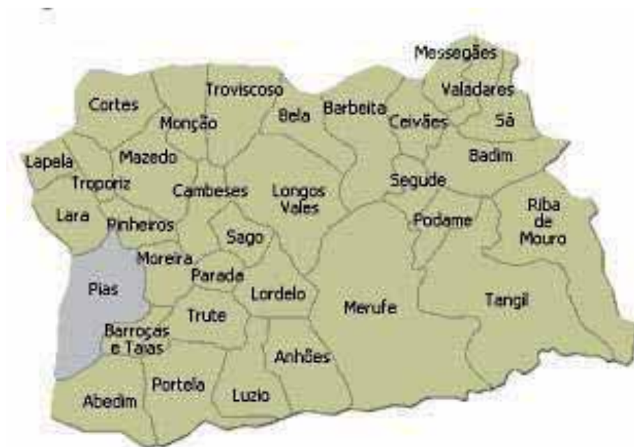
Imagen 0.4. Parroquias de Monção 6 .

Monção es un municipio con 19.956 habitantes en el censo de 2001. Cuenta con un total de 33 parroquias repartidas en una superficie de 211,7 Km 2 . Al norte limita con el río Minho, al oeste con el ayuntamiento de Valença, al este con el de Melgaço y al sur con el de Paredes de Coura y Arcos de Valdevez. Por su lado, Pias es la segunda parroquia más extensa del ayuntamiento con 944 habitantes en 2001 y una extensión de 11, 12 Km 2 . Se encuentra situada a 8 km del centro urbano y limita con las parroquias de Pinheiros y Lara, al norte, Barroças e Taia e Moreira, al este, Abedim y Porreiras (Paredes de Coura), al sur, y Boivão (Valença), al oeste.