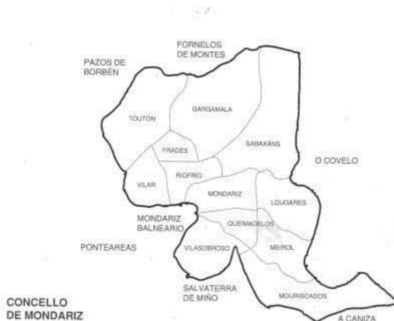
Imagen 0.2. Parroquias de Mondariz 3 .