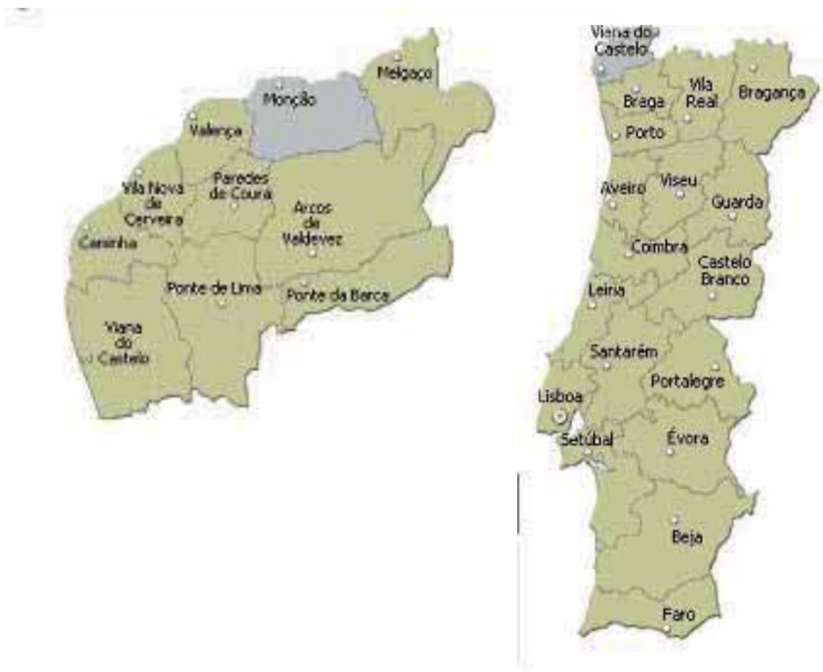
Imagen 0.3. Localización de Monção 5 .

Entro no bar e alí está a chica co seu avó. A rapaza servía no bar. Un home de 60-70 ao que lle faltan tres dedos da man esquerda. Ten algunha falanxe (será carpinteiro?). Falamos do asunto e o home comenta que 150 non pode ser, que antes os que estaban pagaban 200 e que por 150 non alugaba. Imaxinaba este contraataque así que lle comento que a casa está moi ben e que dúas persoas ben podían pagar 100 euros cada unha pero que eu só era moito. Ofreceu que pagase 175 e así quedamos. Dixéronme que agardara uns días para que lle deran unha “limpadela” e logo entrar vivir. Até o mércores non poderían.