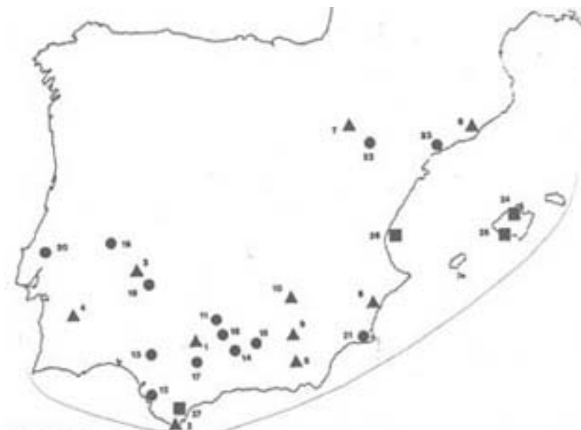
Figura 25. Ubicació de les colònies romanes de la Península Ibèrica (segons J.M. Abascal i U. Espinosa). Els quadrats identifiquen les pre-cesarianes, els cercles les cesarianes i els triangles les augustianes: