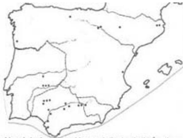
Figura 26. Procedència dels soldats de les legions establertes a la Península Ibèrica abans del 70 d.C. (segons J.M. Roldán Hervás).

La contínua afluència d'immigrants vers Tarraco que es detecta, principalment a les fonts epigràfiques, des dels inicis de l'època imperial va suposar una constant renovació de la població, que, malgrat tot, conservà el seu caràcter homogeni. Entre aquests estrangers hem de destacar la presència dels soldats enviats a la capital provincial en comissió de serveis, que, freqüentment, després de llicenciar-se acabaven per establir-se a la ciutat com a veterans (RIT, Índex 6/b, pp. 502-503). A principis de l'Imperi trobem a Tarraco , sobretot, soldats d'origen itàlic i sud-gàlic (RIT 212, 213, 216, 218, 222 i 223), una procedència que es diversificaria més endavant amb l'arribada de soldats originaris del nord d'Àfrica o de Pannònia (RIT 178, 184, 189, 187 i 229) 493 . Però, la major part dels soldats que trobem a Tarraco procedien de la mateixa Hispania Citerior , especialment del nord-oest de la província, la zona més important de reclutament de la legio VII Gemina , fundada per Galba vers l'any 68 d.C. (RIT 185, 196, 208, 210 i 905), o de les altres províncies hispàniques (RIT 193, 219 i 909) (Fig. 26, 27 i 28) 494 .