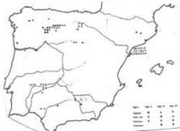
Figura 27. Distribució dels soldats i dels veterans de les legions estacionades a Hispania abans del 70 d.C. (segons J.M. Roldán Hervás).