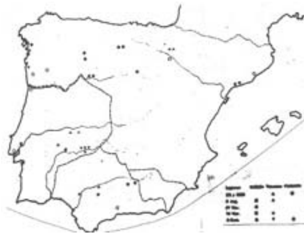
Figura 28. Procedència dels soldats i dels veterans de la legio VII Gemina (segons J.M. Roldán Hervás ).

Paral·lelament, existí també un notable flux migratori de civils vers Tarraco , la major part oriünds de la mateixa Hispania Citerior , a més dels flamines prouinciaie que només vivien a la capital provincial durant el seu mandat (RIT, Índex 7/b, pp. 504-505). A Tarraco arribaren emigrants procedents tant de ciutats properes, com Barcino , Ilerda , Iluro , Auso , etc... (RIT 165, 174, 338, 372-376 i 381; CIL II, 4616 i 6177), com de nuclis més llunyans de l'interior i del nord-oest de la província, com Caligurris , Complutum , Augustobriga , Palentia , etc... (RIT 205, 276, 341, 378-380, 382-385 i 922) ( Fig. 29 ).