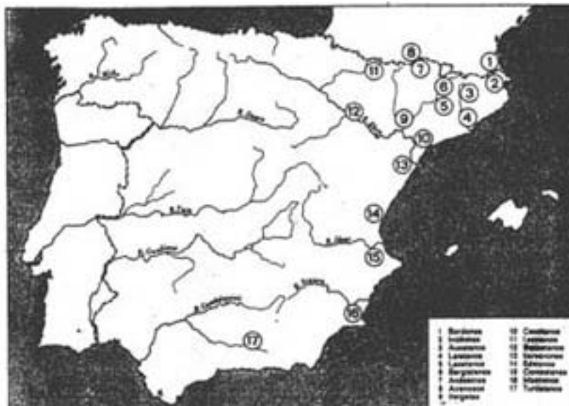
Figura 36. Localització dels diferents pobles ibèrics (segons J. Mangas ).

És especialment significativa la referència aportada per Plini . Aquest autor, al llarg de la seva descripció del litoral nord-oriental de la Hispania Citerior , estableix una diferenciació entre populi i regiones ( Plini , N.H. III, 4, 18-30), fet en el qual R.C. Knapp s'ha fonamentat per a llançar la suggerent hipòtesi de l'existència de dos sistemes d'estructuració del territori conquerit per Roma. Per a Knapp , mentre l'estructura administrativa en regiones fou aplicada a la zona de romanització més primerenca de la Hispania Citerior , l'organització en populi correspongué a la resta de la província menys romanitzada. Knapp ens diu textualment: «it seems probable that Pliny was doing more than just listing geographical areas when he chose the terms he used in his account: Rome seems to have supervised Citerior before the time of Augustus on the basis of regiones along the coast and lower Hiberus river valley, and on the basis of populi in the interior and along the north <we>st coast» 2 .