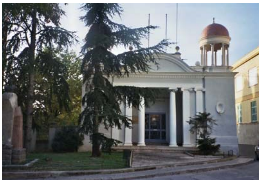
Fig. 18. Edifici de la biblioteca de Valls construït l'any 1918 (2004)

L'edifici, en l'actualitat, encara es conserva en peu i va servir com a biblioteca fins al mes de març de l'any 1995 en què el servei es va traslladar a un local nou, construït al davant d'aquest. Des d'aleshores, l'edifici històric no ha tingut cap ús. La premsa local alertava, ja a l'any 1997, del deteriorament que patia, visible sobretot en la cobertura de les dues cúpules que coronen la construcció. 530 En aquella ocasió els responsables de la Diputació de Tarragona, a qui pertany l'edifici, van reforçar l'estructura pero negant-se a fer cap tipus de recuperació de l'edifici, ja que no s'havien plantejat donar-li cap destí. A l'any 2000, en motiu de les festes decennals de la Mare de Déu de la Candela, fou restaurat. Malhauradament, aquesta restauració alterà l'aspecte de les cúpules dels templets que foren recobertes de mosaic, quan originàriament no duien cap mena d'ornamentació.