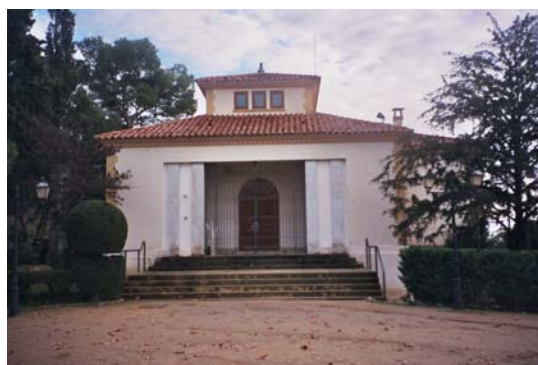
Fig. 20. Edifici de la biblioteca de Sallent (2004)

L'edifici remodelat va ser usat per la biblioteca fins l'any 1989, en què es va traslladar a un local de la Caixa de Manresa i, finalment, el 1999 s'instal·là a l'antiga fàbrica Torres Amat, dins del nucli urbà. L'antic recinte, restaurat als anys noranta per l'Escola-Taller, es troba en bon estat i s'usa en l'actualitat per a diverses activitats del municipi. L'empresa local l'Elèctrica Sallentina contribuí a la urbanització del passeig i ajardinà tot el voltant creant el parc del denominat actualment Passeig de la Biblioteca, al final del qual es troba la biblioteca.