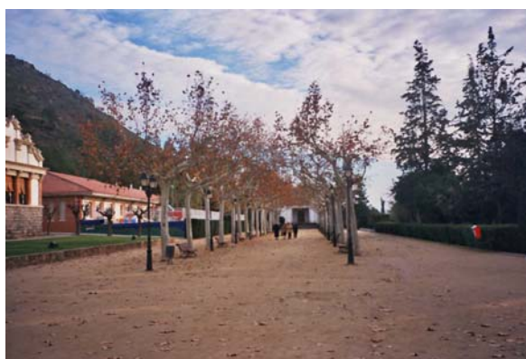
Fig. 21. Passeig de la biblioteca. Sallent. Al fons, la biblioteca (2004)

L'edifici remodelat va ser usat per la biblioteca fins l'any 1989, en què es va traslladar a un local de la Caixa de Manresa i, finalment, el 1999 s'instal·là a l'antiga fàbrica Torres Amat, dins del nucli urbà. L'antic recinte, restaurat als anys noranta per l'Escola-Taller, es troba en bon estat i s'usa en l'actualitat per a diverses activitats del municipi. L'empresa local l'Elèctrica Sallentina contribuí a la urbanització del passeig i ajardinà tot el voltant creant el parc del denominat actualment Passeig de la Biblioteca, al final del qual es troba la biblioteca.