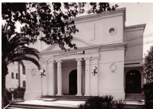
Fig. 24. Edifici de la biblioteca de Canet (2004)

Amb motiu del cinquantenari de la inauguració, s'hi va afegir un pis, amb una entrada lateral per accedir-hi, amb la qual cosa es van eliminar els elements exteriors que cobrien l'edifici. El 1999 la biblioteca es traslladà a l'Ateneu modernista construït per l'arquitecte Domenech i Montaner. El recinte antic de la biblioteca és actualment seu de l'Escola Municipal de música.