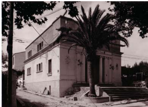
Fig. 23. Obres d'ampliació de la biblioteca de Canet als anys setanta.

La biblioteca de Canet fou la darrera construïda segons els projecte de Lluís Planas. S'edificà en els terrenys cedits per l'Ajuntament en el Passeig de la Misericòrdia, camí del santuari del qual pren el nom, en un solar de 396 m 2 . 538