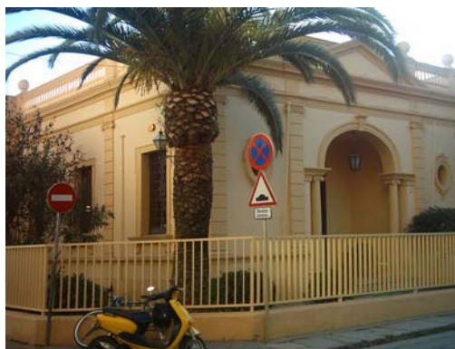
Fig. 26. Edifici de la biblioteca de Pineda (2004)