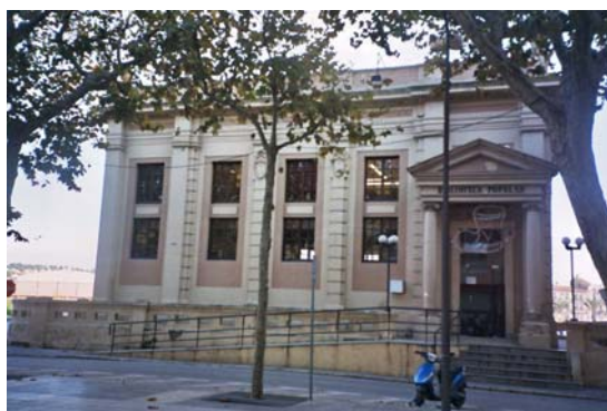
Fig. 25. Edifici de la biblioteca del Vendrell (2004)

Projectat per Ramon Puig Gairalt, l'edifici de la biblioteca del Vendrell és el primer que no segueix el model dissenyat per Lluís Planas, aplicat a les anteriors biblioteques. Fou construït en un solar de 718,54 m 2 cedit per Joan Ferrer Nin en un emplaçament cèntric, a la Rambla del 4 de març, prop de l'estació del tren. La construcció fou adjudicada a Salvador Serra i Porta per 38.802,90 ptes.