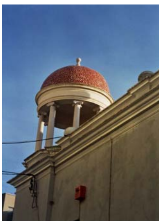
Fig. 19. Detall de la cúpula de la biblioteca de Valls (2004)

L'edifici, en l'actualitat, encara es conserva en peu i va servir com a biblioteca fins al mes de març de l'any 1995 en què el servei es va traslladar a un local nou, construït al davant d'aquest. Des d'aleshores, l'edifici històric no ha tingut cap ús. La premsa local alertava, ja a l'any 1997, del deteriorament que patia, visible sobretot en la cobertura de les dues cúpules que coronen la construcció. 530 En aquella ocasió els responsables de la Diputació de Tarragona, a qui pertany l'edifici, van reforçar l'estructura pero negant-se a fer cap tipus de recuperació de l'edifici, ja que no s'havien plantejat donar-li cap destí. A l'any 2000, en motiu de les festes decennals de la Mare de Déu de la Candela, fou restaurat. Malhauradament, aquesta restauració alterà l'aspecte de les cúpules dels templets que foren recobertes de mosaic, quan originàriament no duien cap mena d'ornamentació.