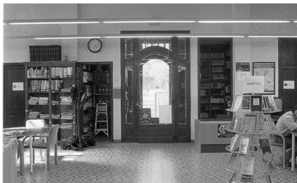
Fig. 27. Interior sala de lectura (2004)

La biblioteca conserva, en l'actualitat, l'aspecte exterior originari. Amb els anys l'edifici només ha sofert una ampliació lateral i reformes interiors per adaptar-se a les necessitats actuals ja que segueix essent la biblioteca pública de la localitat.