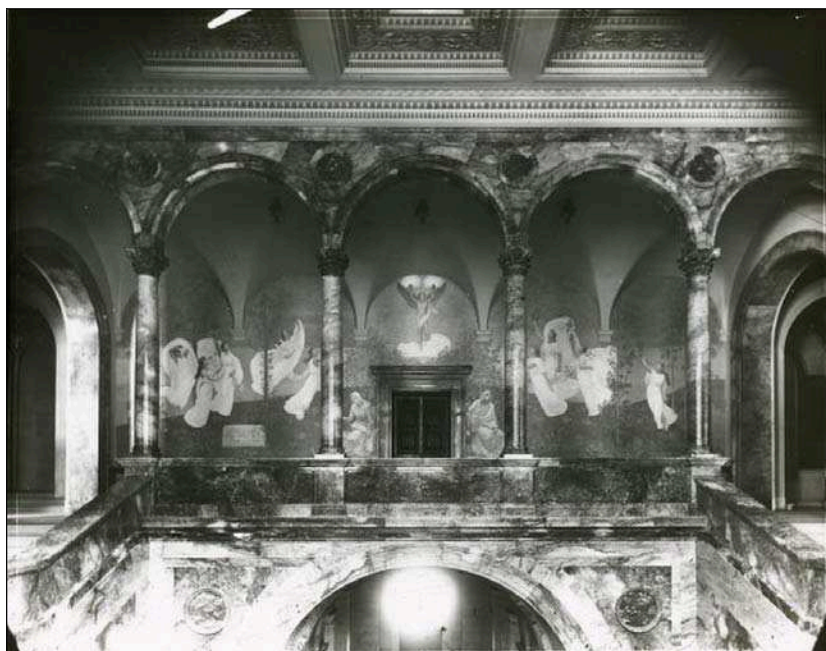
Boston Public Library. Mural de Puvis de Chavannes. Les muses inspiratrices acclamant le Génie messenger de lumière.

Les biblioteques ofereixen unes col·leccions ben assortides de fons moderns instructius i d'entreteniment, disponibles bé per a la consulta en sala, bé per al préstec. El préstec a domicili és una pràctica habitual i, de mica en mica, es facilita la lectura permetent l'accés lliure als prestatges, pràctica iniciada als Estats Units que s'adoptarà de forma generalitzada a Anglaterra a partir de 1891. L'accés és obert a tothom, motiu pel qual la biblioteca integra una gran diversitat de necessitats d'informació i de lectura: suport a la instrucció i a la formació professional, esbarjo, informació i conservació del patrimoni local, educació moral, suport a la investigació, etc. Val a dir, tanmateix, que les idees de progrés i de millora professional, no amagaven una voluntat explicitada de reforma social i del convenient ús de l'oci entre les classes menys acomodades, amb la intenció d'allunyar-les dels vicis i afavorir la seva promoció social.