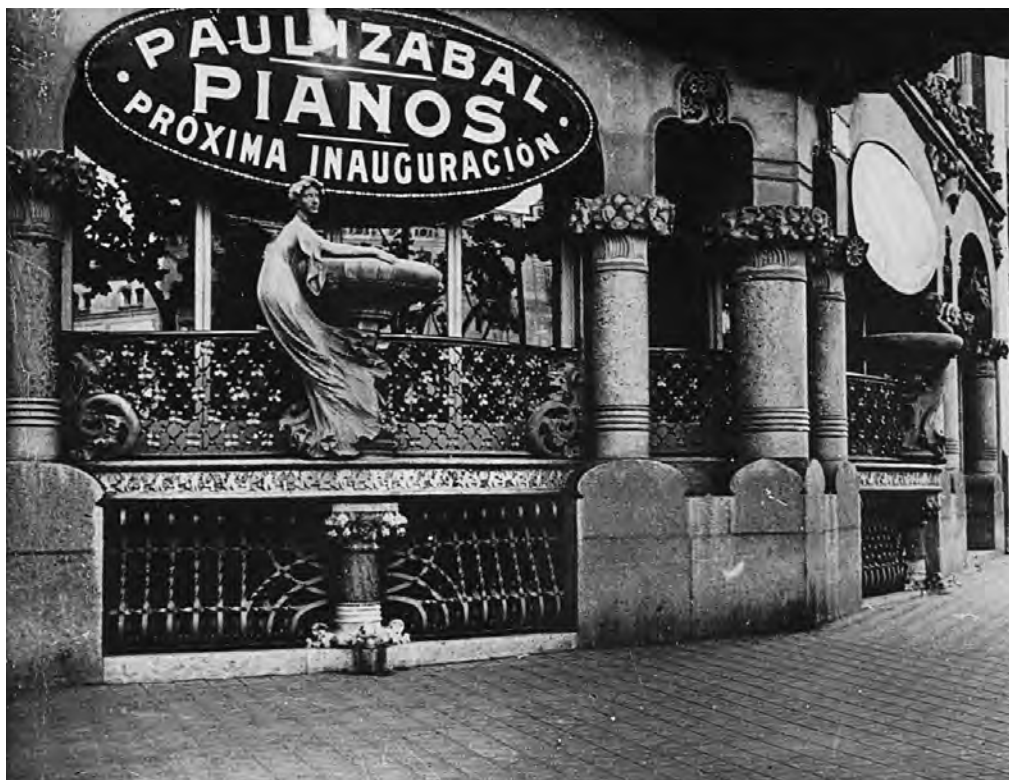
Els baixos de la casa Lleó Morera el 1916. Agrupació Fotogràfica de Catalunya.

conflicte va acabar amb el trasllat del Cercle Artístic a una nova seu situada al número 33 de la Rambla de Catalunya i amb el fabricant de pianos Paul Izabal com a nou llogater dels baixos, després del pas efímer del Círculo de Bellas Artes o la Casa América 1387 .