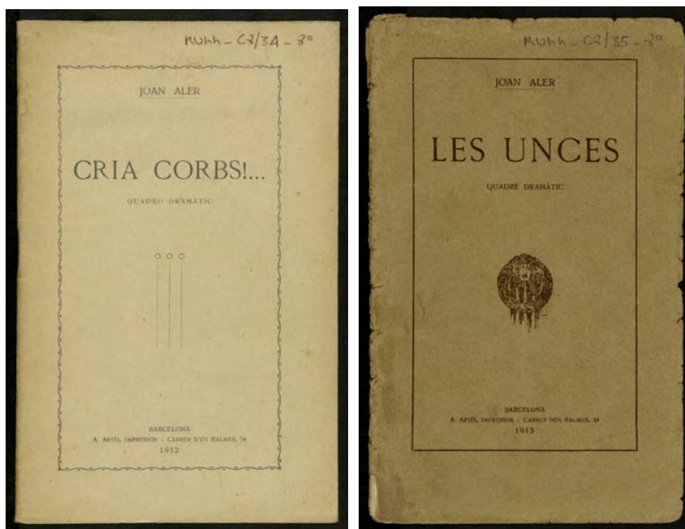
Portades de Cria Corbs!... i Les Unces , 1912-1913. BC.