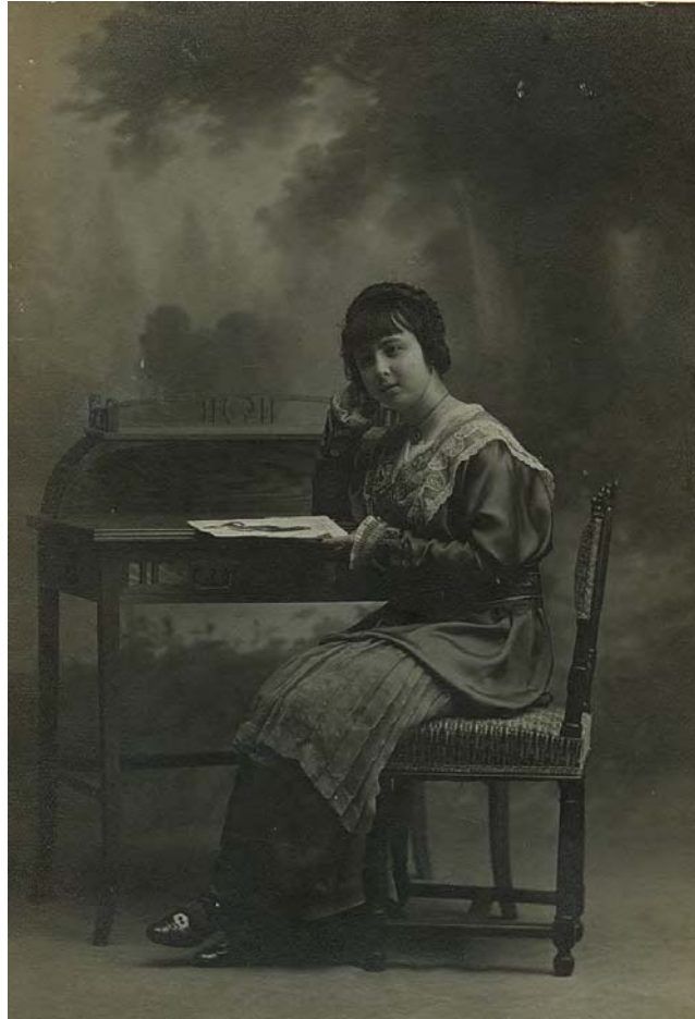
Pau AUDOUARD, Retrat d'una noia, c. 1914. Col·lecció particular

L'activitat de l'estudi va anar, igualment, vinculada a les campanyes promocionals dels mateixos grans magatzems, com podia ser amb tota la gama de productes relacionats amb les primeres comunions. Així, enmig d'un anunci a pàgina sencera d' El Siglo de novetats d'estiu i, entre elles, d'articles per a la primera comunió, el fotògraf anunciava: Galería Fotográfica (3er piso): Retratos para Primera Comunió. Dirección artística: Audouard 1422 . Les fotografies de primeres comunions es sumaven a l'activitat retratística més comuna que Audouard va anar realitzant en el taller dels grans magatzems El Siglo , com podien ser retrats de posades de llarg , de militars o de matrimonis recents casats. Pel comú, es tracta de retrats corrents que destaquen per una renovada presència d'ambientació, essent precisament l'absència d'atrezzo una de les característiques més personals de l'obra anterior d'Audouard. És per aquest motiu –per l'estandarització dels retrats segons les convencions del mercat– que només en comptades excepcions, i molt especialment a l'inici d'aquest estudi, els treballs sorgits d' El Siglo van ser motiu de notícia en premsa: