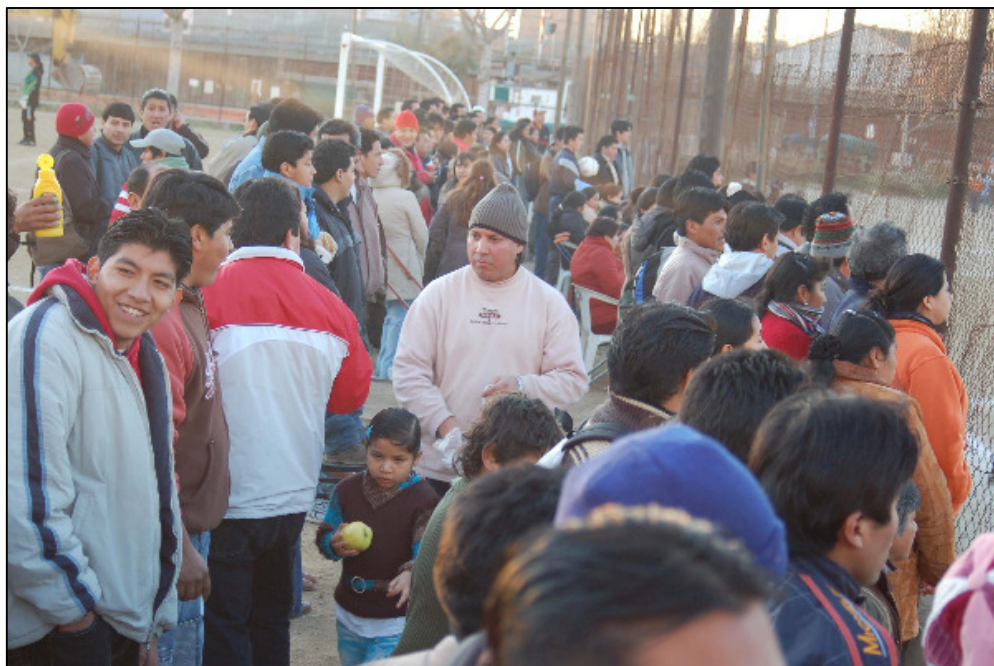
Fig. 39. El público se aglutina en el lateral del Gornal.

podían observar los partidos porque el tejido de alambre ferruginoso que separaba el campo de la calle lo permitía. Era bastante habitual esta forma de reunirse fuera, poniendo la música muy alta en sus automóviles y mirando el partido con cierta intimidad. Era habitual ver en el bar del espacio a diferentes personas que se relacionaban mientras bebían cerveza, la bebida más consumida por los latinoamericanos. Había quienes cantaban al compás de la música, que siempre sonaba debajo del entoldado que hacía de terraza al aire libre.