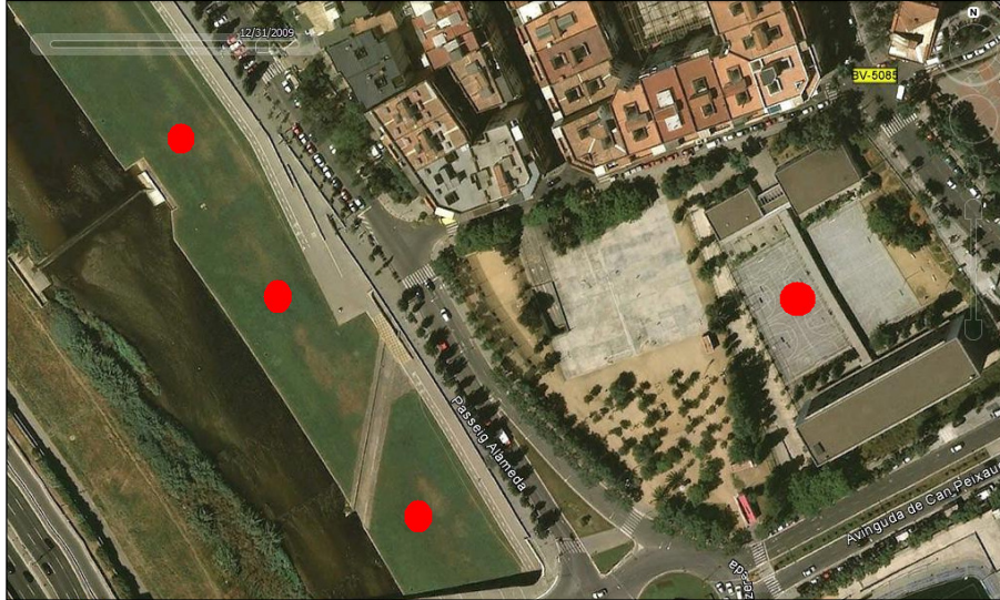
Fig. 42 Espacios deportivos en el río Besòs y pistas polideportivas de Can Peixauet.

La zona muy populosa y con un alto porcentaje de población de última inmigración, generaba en el espacio muchas ocupaciones transitorias. La pista polideportiva congregaba a personas latinoamericanas para jugar al fútbol y al baloncesto. La mayoría son chicos latinos, a los que se añadían algunas chicas “autóctonas” acompañándoles sentadas en los bancos de los laterales del campo de juego.