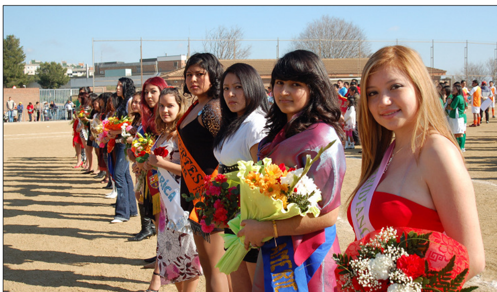
Fig. 44. Las madrinas de los equipos durante el concurso de “misses”.

Inauguración de la liga en La Guineueta. 28 de enero de 2007. La tarde de invierno se mostraba plácida; el sol favorecía el estar en el espacio. La gente, bulliciosa, se aprestaba a escuchar los parlamentos y a observar el desfile de los equipos mientras que, los integrantes de estos, se vestían de corto para desfilan. Las “señoritas madrinas”, engalanadas con vestimentas llamativas parecían orgullosas algunas y tímidas otras al mostrarse ante tantas personas, sabiendo que iban a ser objeto de sus comentarios.