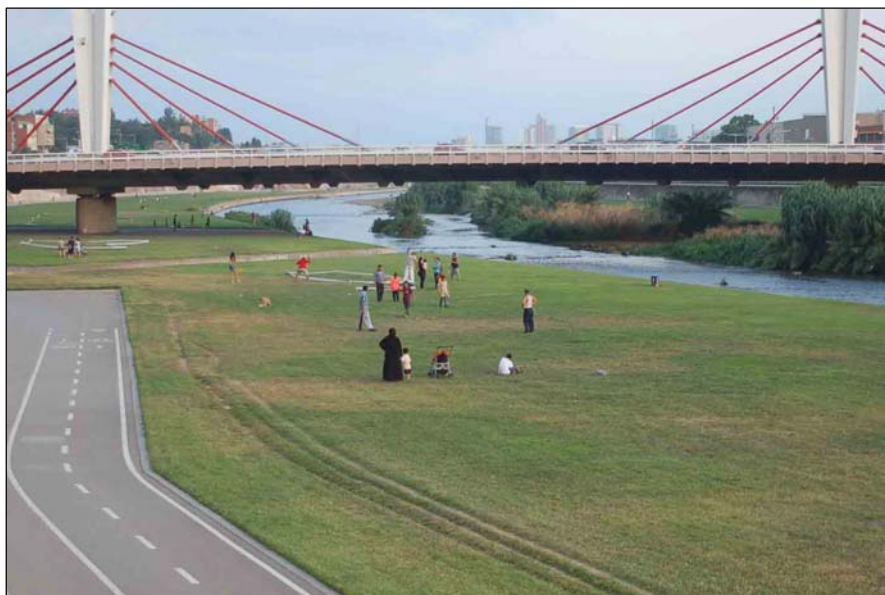
Fig. 43. Atardecer estival en la orilla del río. Muchas personas ya marcharon, no quedan demasiados vestigios de su paso.

La recuperación de este espacio público dio lugar a ocupaciones momentáneas de diferentes colectivos de personas originarias de distintos países, entre ellas, las que conformaban las redes sociales latinoamericanas.