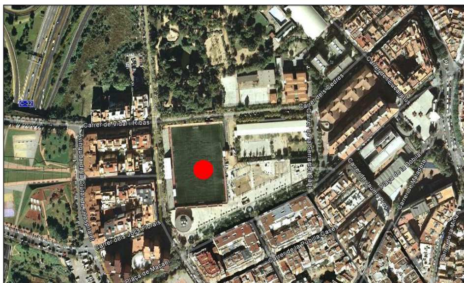
Fig. 37. Municipal Can Vidalet con la hierba artificial.

Sobre la calle del Molí, a cuatro manzanas al sur de la calle Laureà Miró de Esplugues de Llobregat, el campo de Can Vidalet se ubica en dirección norte - sur. En su parte oeste, la densidad de viviendas contrasta con la zona norte, donde está el parque de Can Vidalet. Por el este linda con un colegio, y por el sur lo limita la calle del Molí, que hace esquina con la calle Verge de la Mercè.