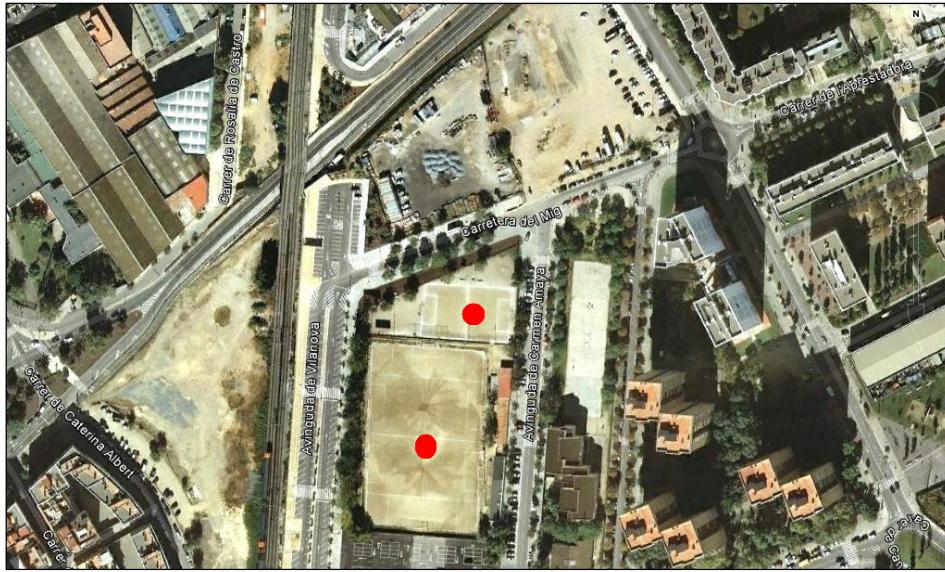
Fig. 38. Imagen de ambos campos del Gornal.

El proyecto del Ayuntamiento consistía en retirar los campos de fútbol para construir un polideportivo, no obstante, hasta 2010, esta idea no se había concretado y los bolivianos y bolivianas seguían jugando en los dos campos de fútbol: en el de fútbol siete la Liga Deportiva Boliviana se encargaba de las competiciones, espacio en el cual solamente había personas originarias de Bolivia y donde, además, se organizaban ligas femeninas. El campo de fútbol, gestionado por la Liga Social Boliviana de Cataluña, estaba abierto a distintas nacionalidades, no tenían las restricciones de origen que imponía la liga del espacio pequeño y solamente jugaban equipos masculinos.