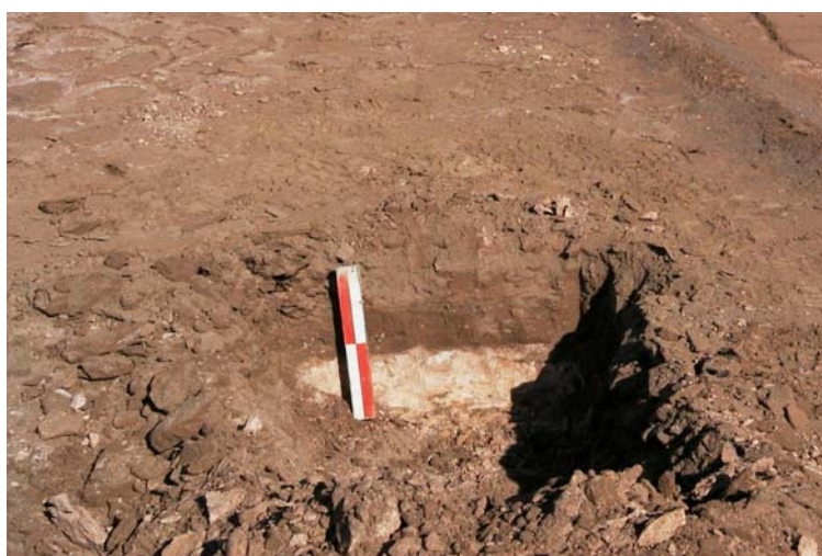
Figura 6.6.- Muestra SIC6.

Horizonte superficial de suelo con dos tipos de material al 50%; uno de color marrón fuerte (7.5YR4/5) en estado húmedo y pardo débil (7.5YR6.5/3) seco; el otro de color gris pálido (N7/0) húmedo y blanco (N8/0) en estado seco. Estructura poliédrica subangular débilmente desarrollada. Ligeramente adherente. Friable; ligeramente duro. Se observan inclusiones rojo amarillentas (5YR5/6) cuando está húmeda y rosa (5YR7/4) cuando se encuentra seca. Tiene algunas gravas.