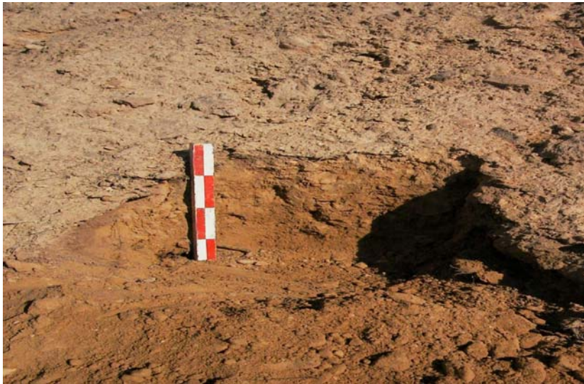
Figura 6.7.- Muestra SIC7.

Corresponde al horizonte superficial de un suelo que presenta las siguientes características: amarillo parduzco (10YR6/8) en estado húmedo y amarillo (10YR8/6) en seco. Sin estructura, tendiendo a laminar en superficie. Ligeramente adherente; plástico; friable; ligeramente duro. No tiene gravas.