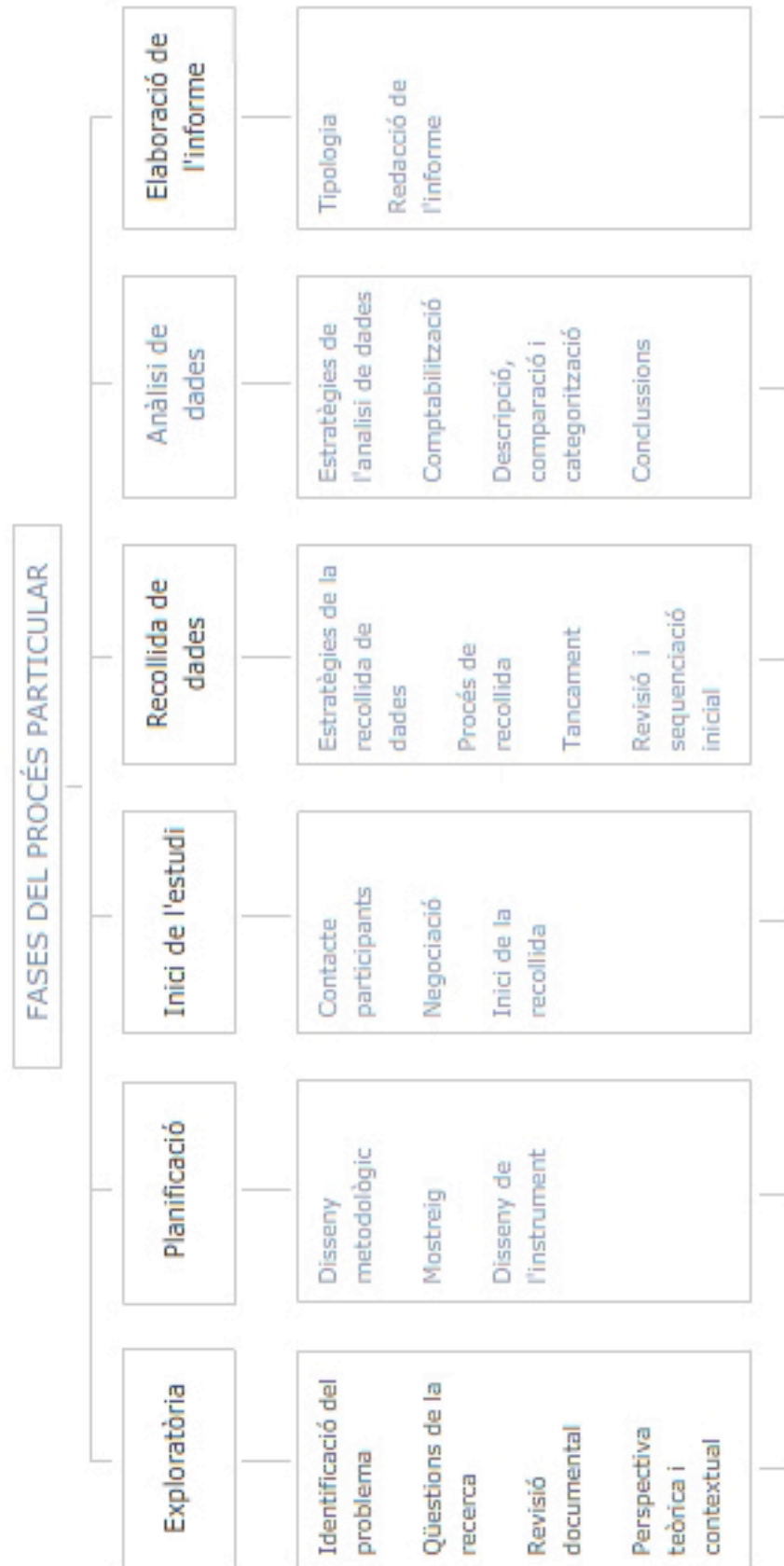
Fig. 5_2. Esquema de les fases seguides en aquesta tesi, basades en la proposta de procés d'Arnal et al. 1996.