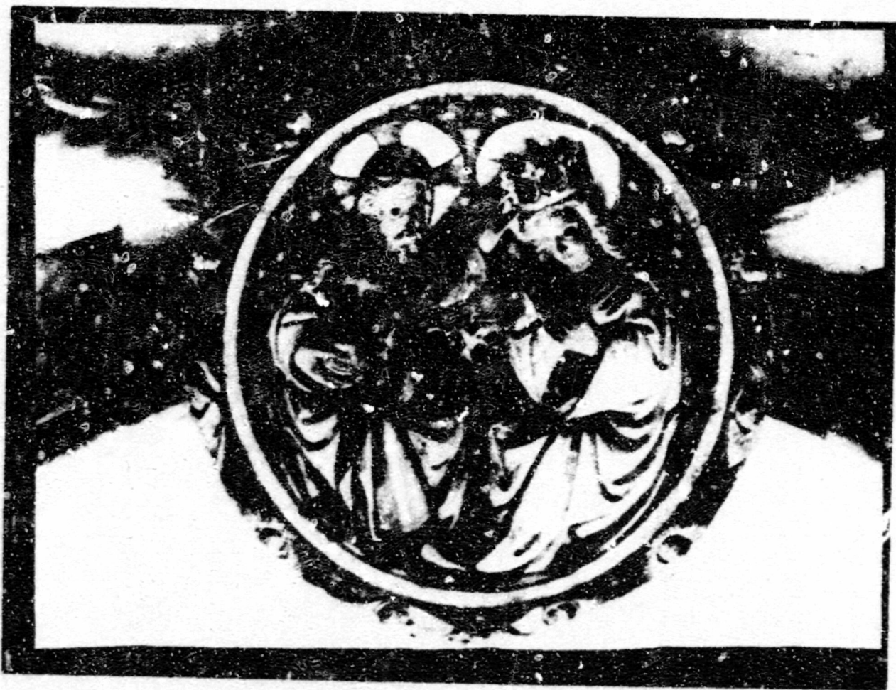
Fig.156. Coronació. Castelló d'Empúries, esg. parroquial, clau de volta.