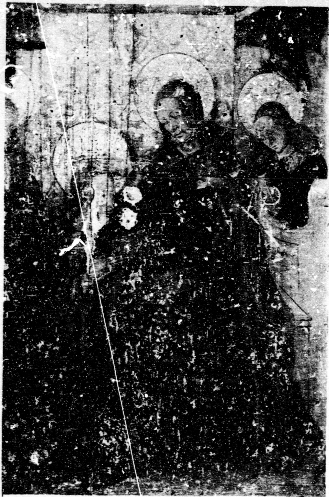
Fig.151. Coronació. Benavarri, esg. parroquial, ret. de la Verge.