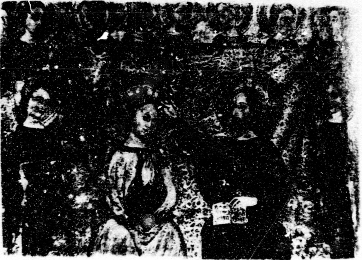
Fig.152. Coronació. Bilbao, Museo de Bellas Artes, ret. pro_ cedent de Vilamur.