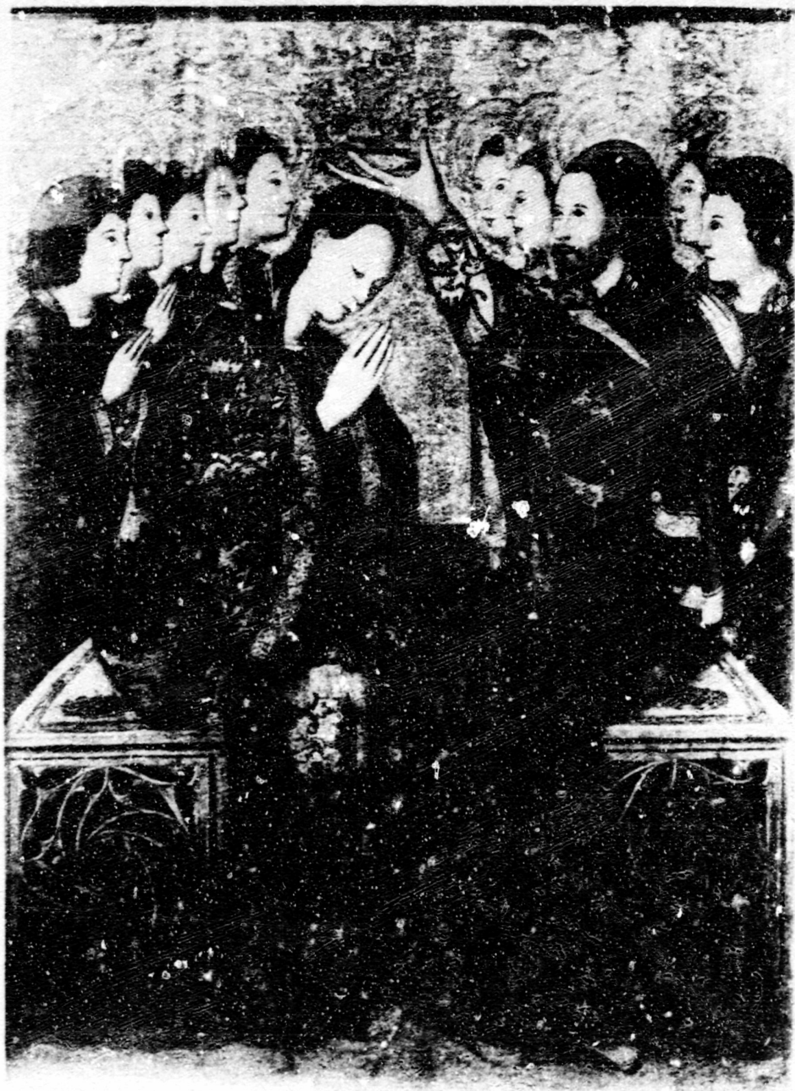
Fig.154. Coronació. Boston, M. Fine Arts, taula solta.