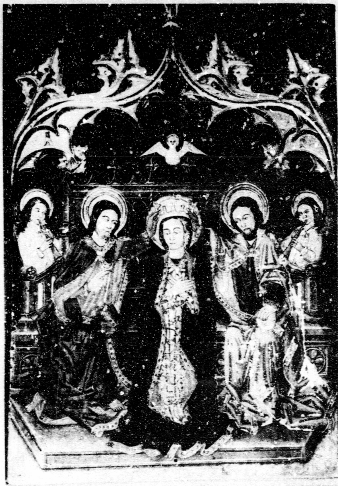
Fig.153. Coronació, Bolvir, esg. parroquial. ret. dels Goigs ma- rians.