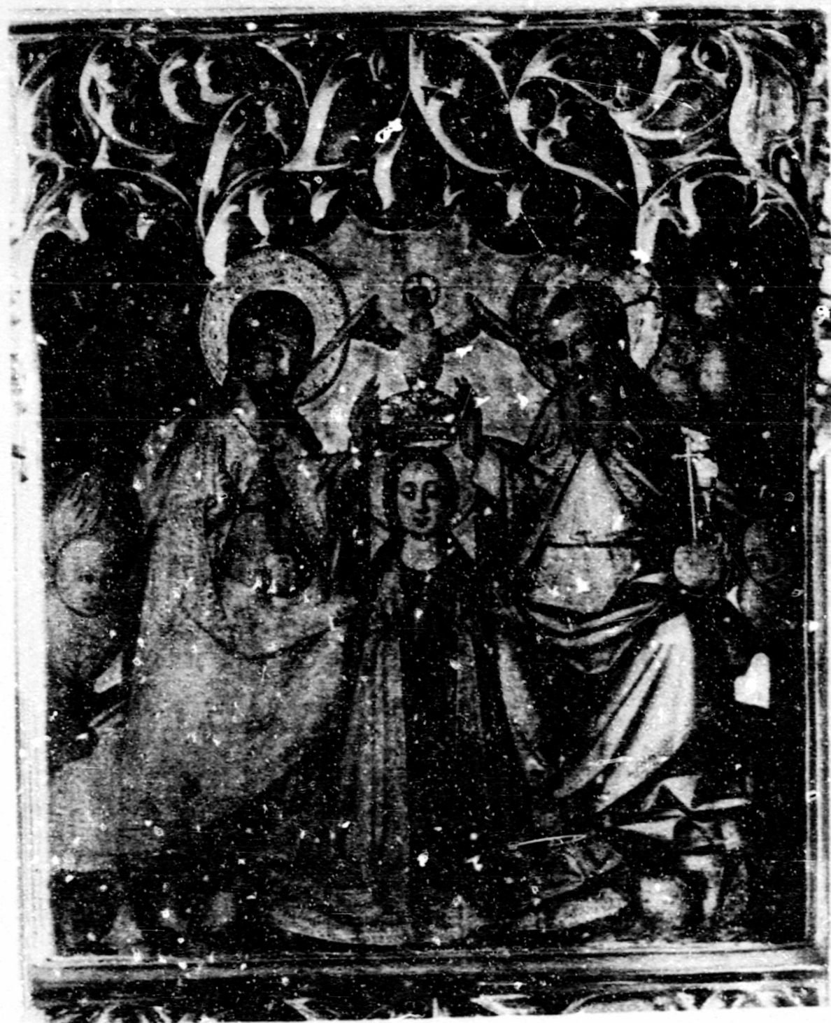
Fig.149. Coronació. Barcelona, M.N.A.C., ret. de S. Jaume.