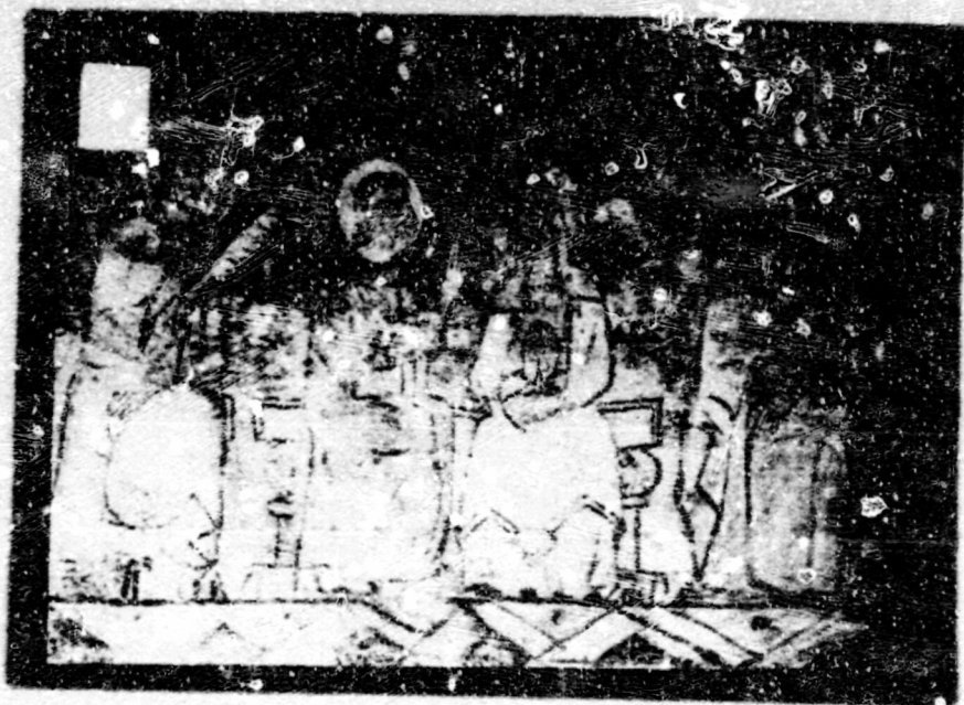
Fig. 155. Coronació. El Bruc, esg. parroquial, pintura mural.