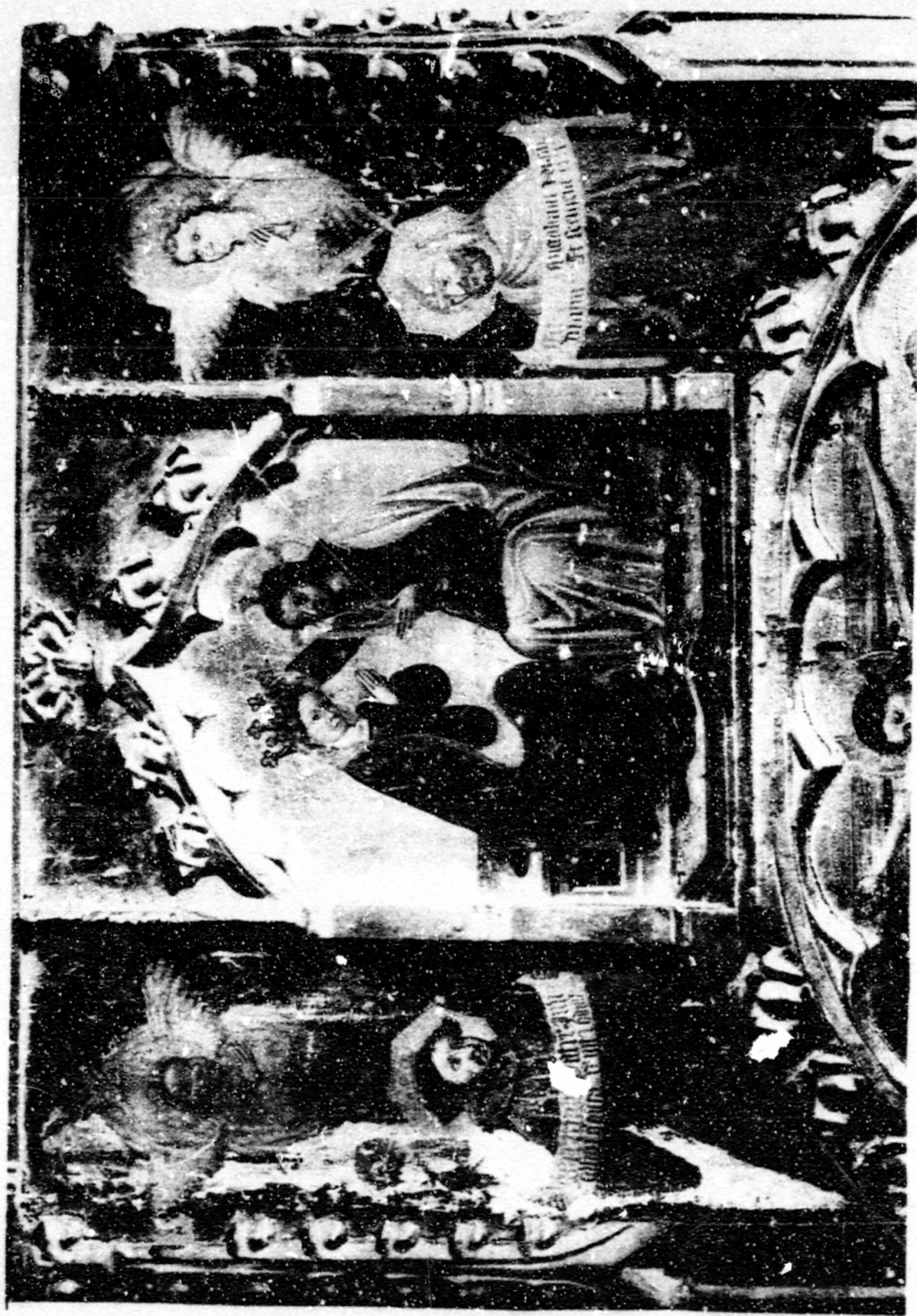
Fig. 158. Coronació. Collado, esg. parroquial, ret. de la Verge.