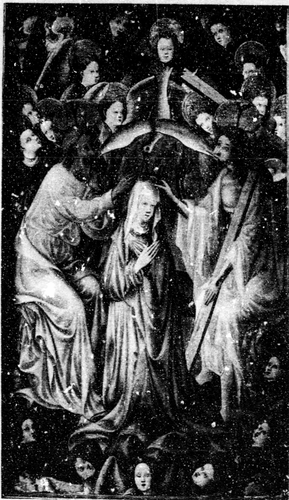
Fig.157. Coronació. Cleveland, M. Art, taula solta.