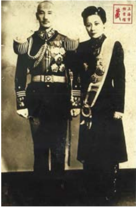
Ilustración: Foto de Chiang Kai-shek y Song Mei-ling.