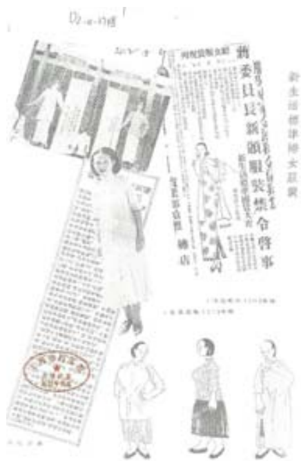
Ilustración: Archivo de la Ciudad Shanghai, D2-0-2748, Xinshenghuo biao zhuan funu fuzhuang (Vestimenta estándar del Movimiento de la Nueva Vida), 1936.