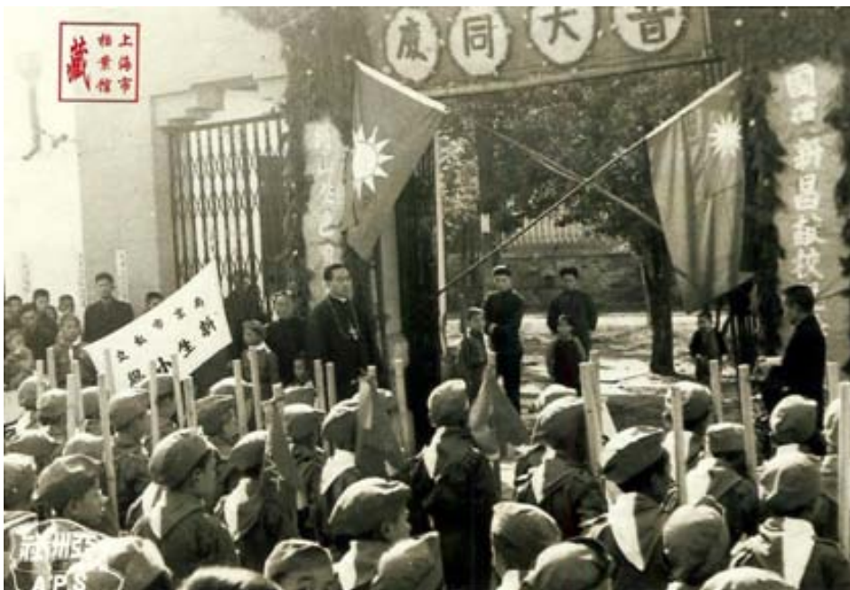
Ilustración: Imagen de una concentración de estudiantes escultistas de Escuela Primaria de Shingsheng, en la capital Nanjing, con la presencia de un cura cristiano.