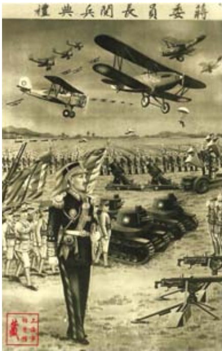
Ilustración: Propaganda militar del Ejército del GMD con imagen de Chiang Kai-shek.