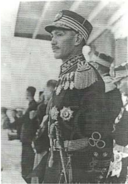
junshi weiyuanhui weiyuanzhang Jiang Zhong-zheng zhichi quanguo tongzijun dierci da jianyue (El Generalísimo del Consejo Militar Chiang Kai-shek dirige la segunda concentración nacional de escultistas), 8 de octubre de 1936.