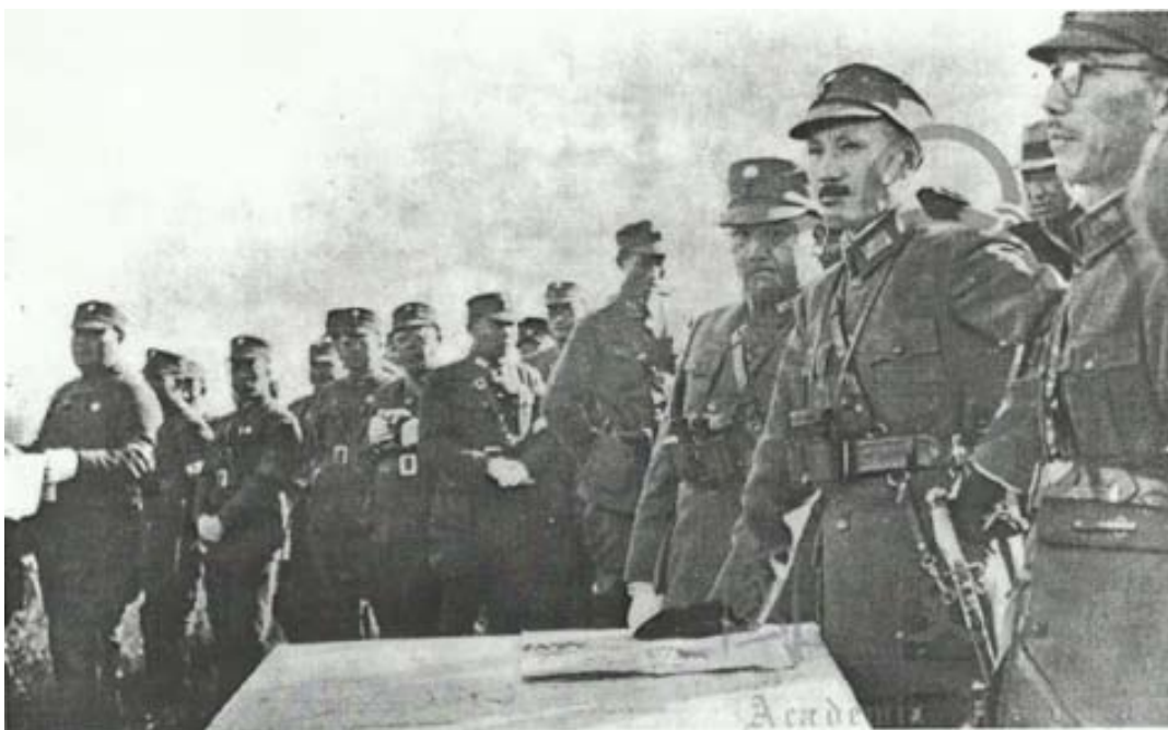
Junshi weiyuanhui weiyuanzhang Jiang Zhong-zheng yu qianxian zhihui jiaofei (El Generalísimo del Consejo Militar Chiang Kai-shek dirige el Exterminio del Bandolerismo en el frente), 1934.