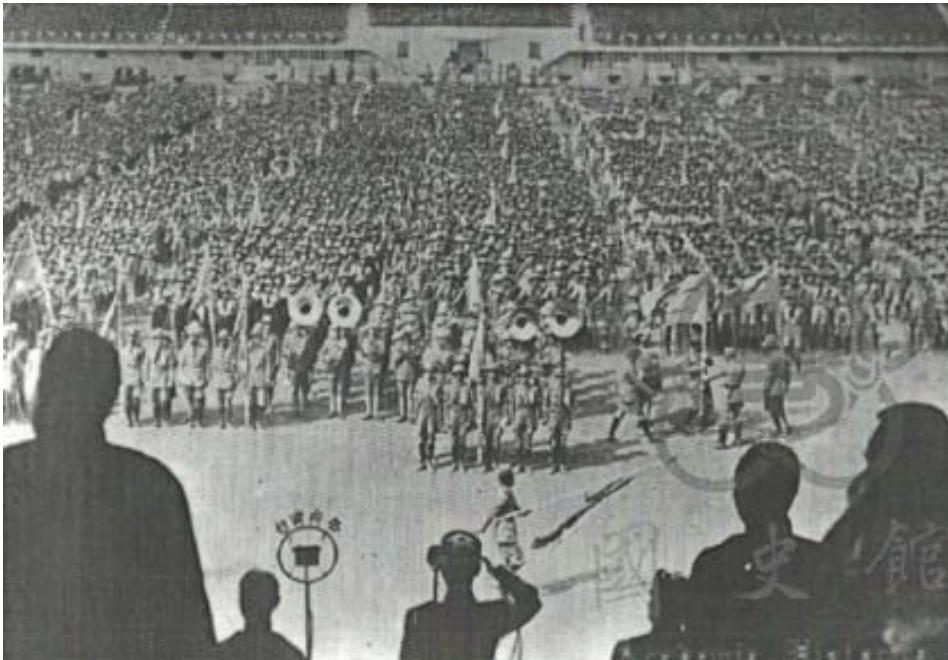
Quanguo tongzijun dierci jianyue zhi shengkuang (La gran ceremonia de la segunda concentración nacional de escultistas), 8 de octubre de 1936.