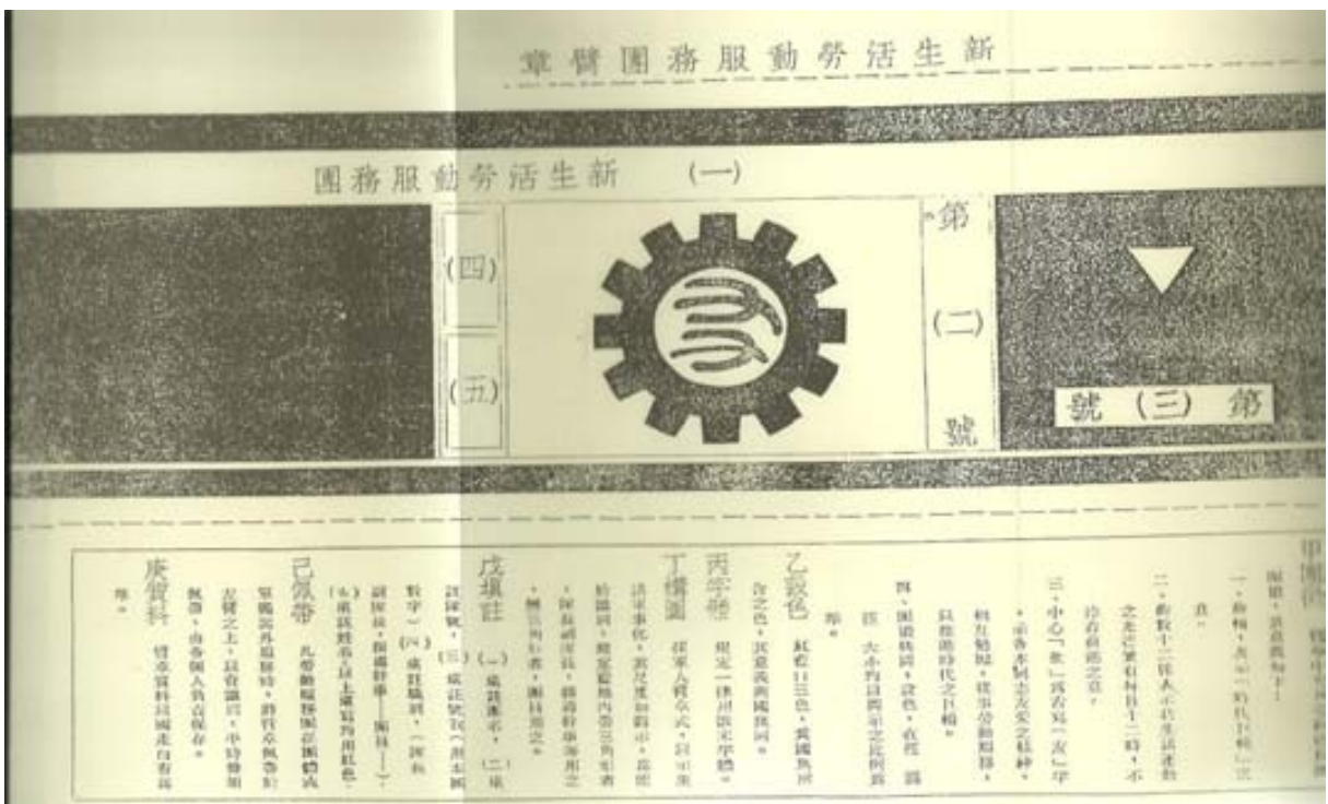
Ilustración: brazalete del Xinshenghuo laodong fuwutuan (Grupo de Servicio del Movimiento de la Nueva Vida). ( Jindai zhongguo shiliao congkan, Mingguo ershisinian quanguo xinshenghuo yundong, shang (Colección de documentos históricos de la China Moderna. El Movimiento de la Nueva Vida nacional de 1935, I), vol. 528, Taipéi: Wenhai, 1989, s.p.