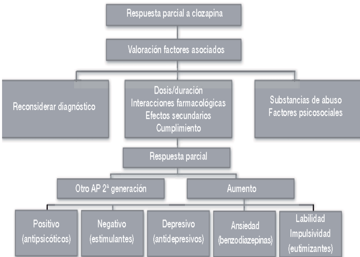
FIGURA 4. Esquema de actuación en respondedores parciales a clozapina

Extraído de "Estrategias Terapéuticas de los trastornos psiquiátricos resistentes: esquizofrenia", en Manual de Psiquiatría, Cap. 20, 2009:291.