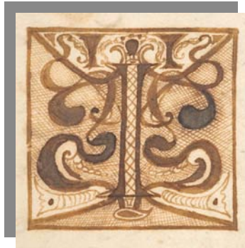
Laus Deo Virginique Matri