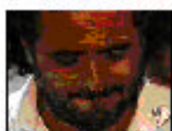
Escenario: El asesinato Personaje: Padre de la víctima Nombre: Victorio de Vilas