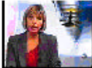
Presentadora / Platô Lugar: Repórter sobre sobre de la Policía