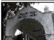
Escenario: Dos veredas Hecho: Chillera de víctimas Caracteres: José para TV 1999