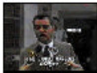
Personaje: abogado de defensas Entrevista: Corresponsal de la Policía Militar de São Paulo