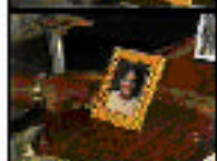
Personaje: Victima (foto) Escenario: Consejo Nombre: Victorio de Vilas