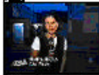
Personaje: reportero Entrevista: Corresponsal de la Policía Militar de São Paulo