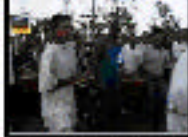
Escenario: Dos veredas Hecho: Chillera de víctimas Caracteres: José / Chico