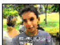
Escenario: Consejo Personaje: Amigo de la víctima