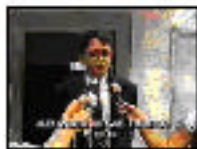
Personaje: fiscal Entrevista: Corresponsal de la Policía Militar de São Paulo