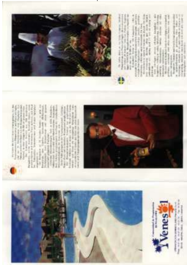
Ilustración 14: El apartamento- hotel.