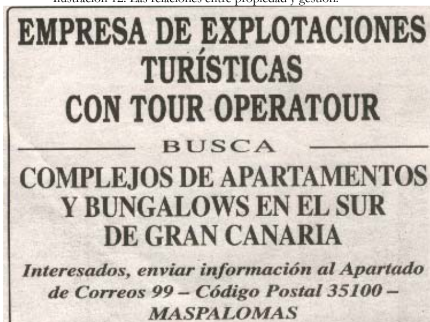
Ilustración 12: Las relaciones entre propiedad y gestión.

Fuente: Anuncio aparecido en La Provincia- Diario de Las Palmas, domingo 12 de Mayo de 2002, contraportada.