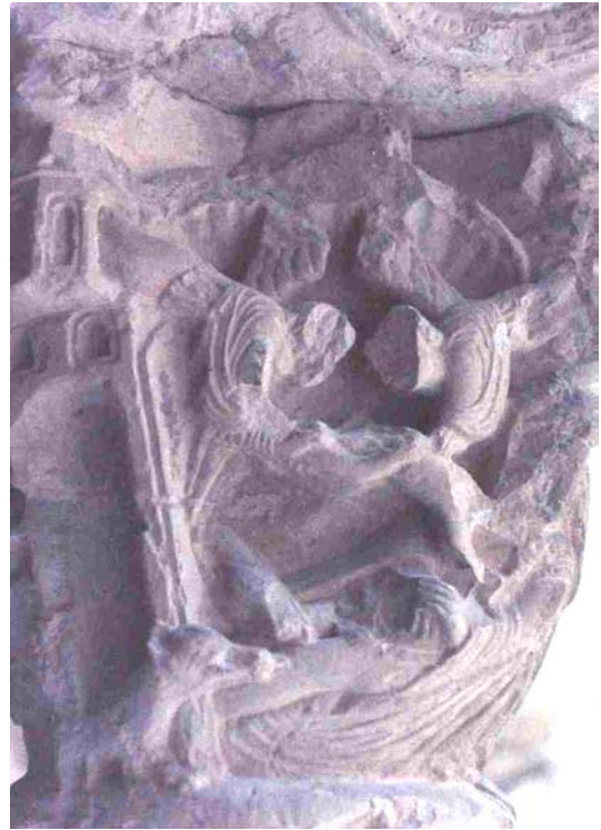
Fig. 2.- Claustro de la catedral de Gerona.