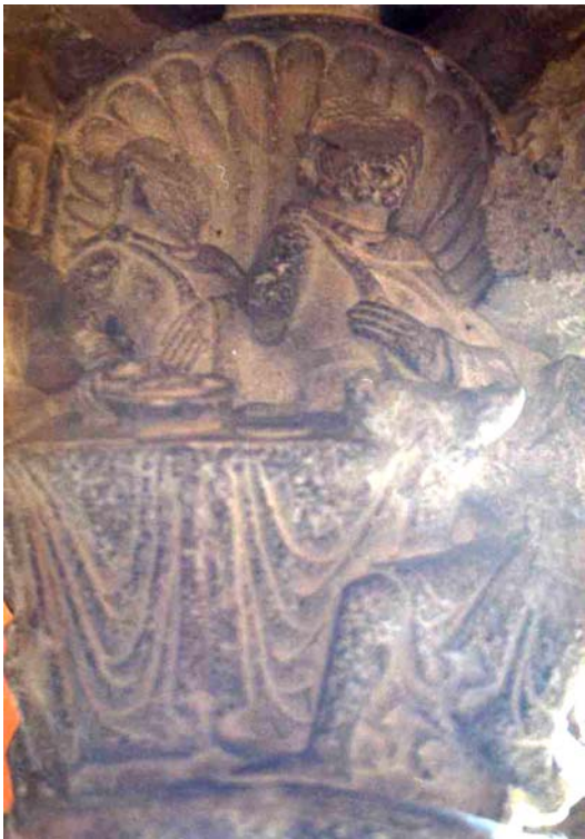
Fig. 9.- Claustro del monasterio de Sant Cugat.. Banquete del epulón.