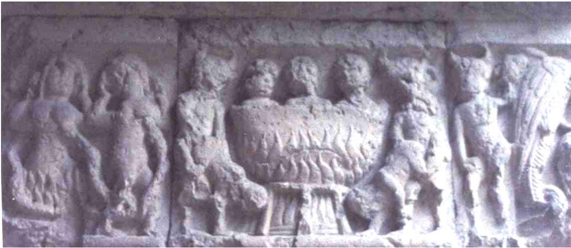
Fig. 7. Claustro de la catedral de Gerona. El infierno.