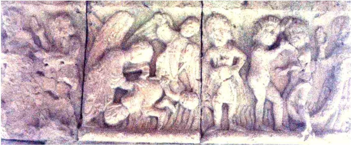
Fig. 5. Claustro de la catedral de Gerona. El infierno.