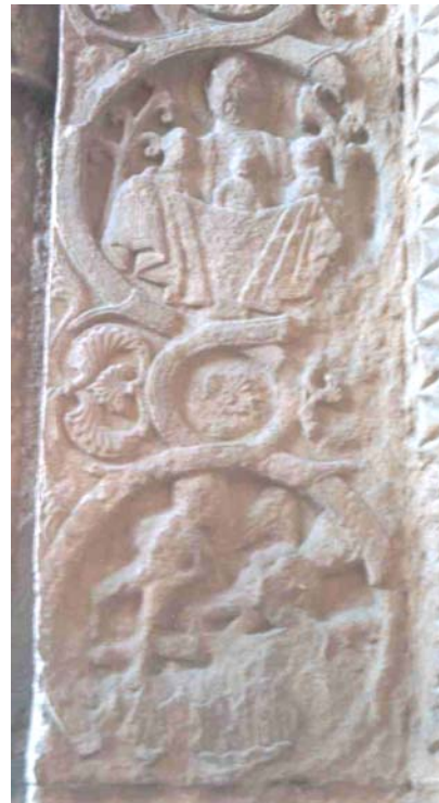
Fig. 16.- Portada de Sta. M a de Ripoll. El alma de Lázaro en el seno de Abraham y la del epulón en el infierno.