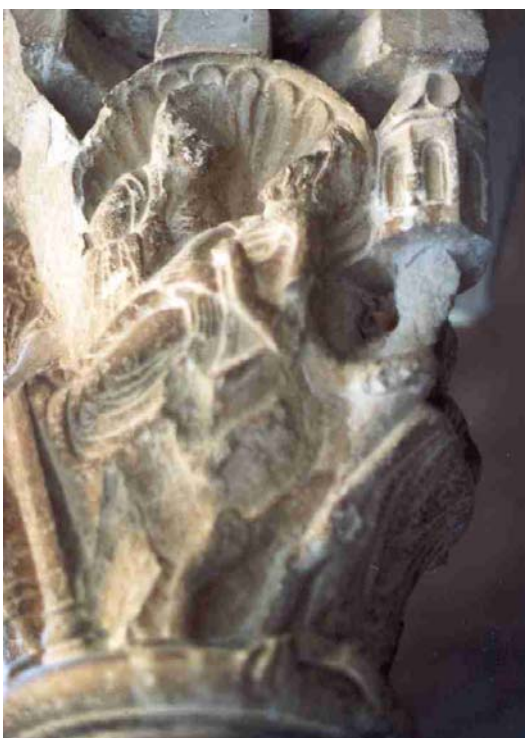
Fig. 11.- Claustro del monasterio de Sant Cugat. La muerte del epulón.