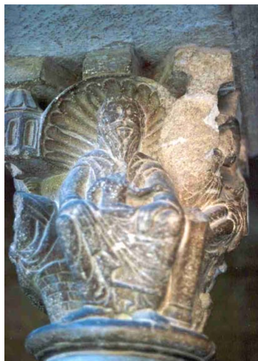
Fig. 12.- Claustro del monasterio de Sant Cugat. El alma de Lázaro en el seno de Abraham