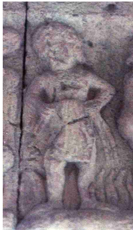
Fig. 6. Claustro de la catedral de Gerona. Castigo del avaro (?).