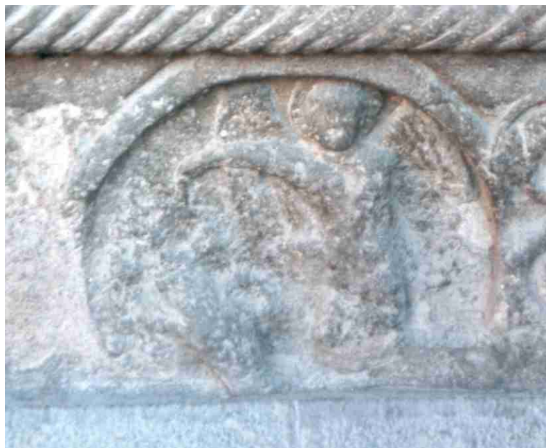
Fig. 14.- Portada de la iglesia de Sta. M a de Ripoll. Zócalo derecho. Psicostasis (?).