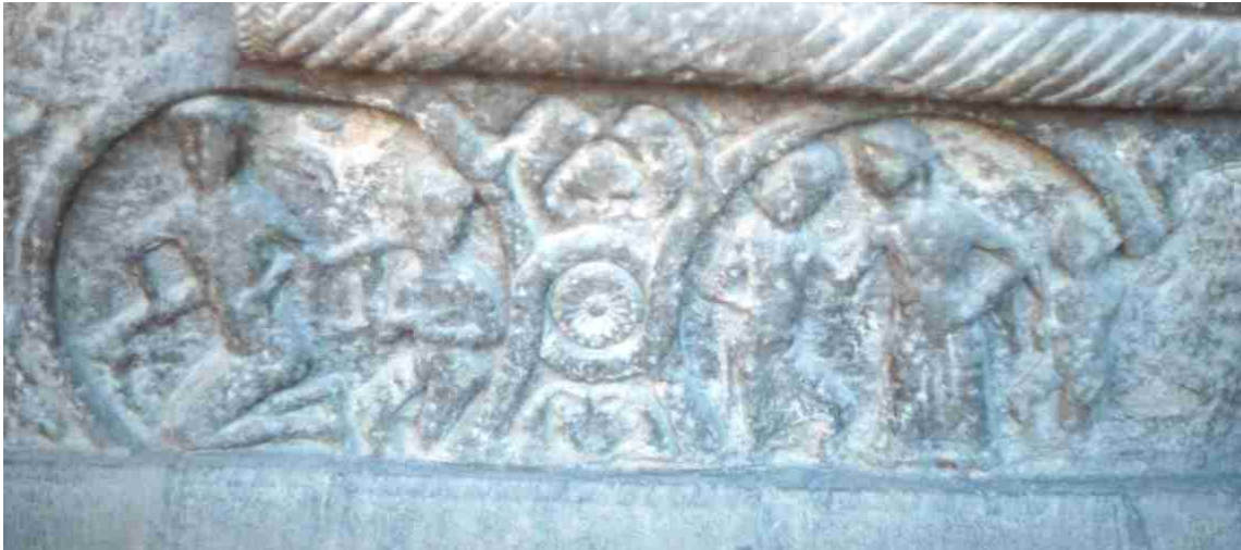
Fig. 13.- Portada de la iglesia de Santa M a de Ripoll. Zócalo derecho. Diablos incitando al pecado.