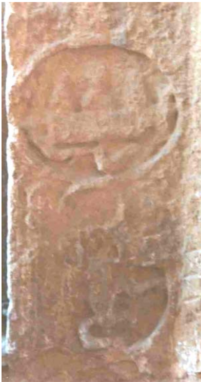
Fig. 15.- Portada de Sta. M a de Ripoll. Los perros lamiendo las llagas de Lázaro y el banquete del epulón.