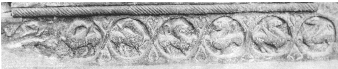
Fig. 17.- Portada de Sta. M a de Ripoll. Zócalo izquierdo. Medallones con leones y grifos.