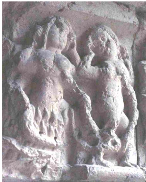
Fig. 8. Claustro de la catedral de Gerona. Castigo de la lujuria.