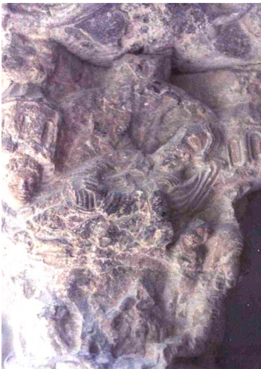
Fig. 3.- Claustro de la catedral de Gerona. Muerte del epulón.