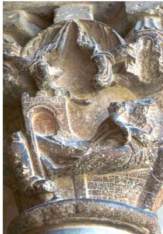
Fig. 10.- Claustro del monasterio de Sant Cugat. Muerte de Lázaro.