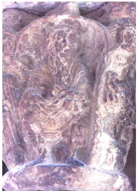
Fig. 4.- Claustro de la catedral de Gerona. El alma de Lázaro en el seno de Abraham