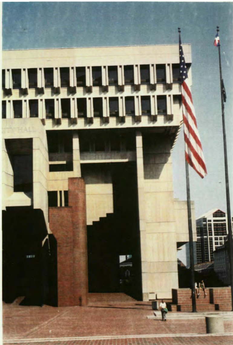
A DALT: DETALL DE L'AJUNTAMENT DE BOSTON DE KALLMAN I MACKINELL, 1967. A BAIX: FAÇANA DEL NEW ENGLAND AUDITORIUM, BOSTON. MATEIXOS ARQUITECTES, 1989.