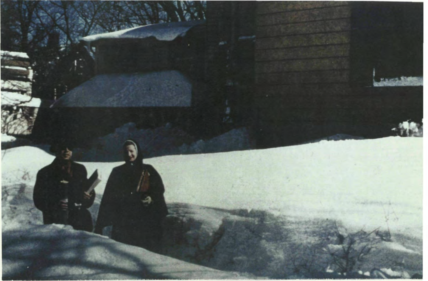
JOSEP LLUIS I MONCHA SERT.