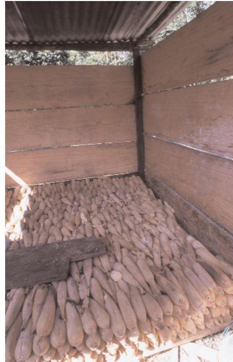
Muro de tablon