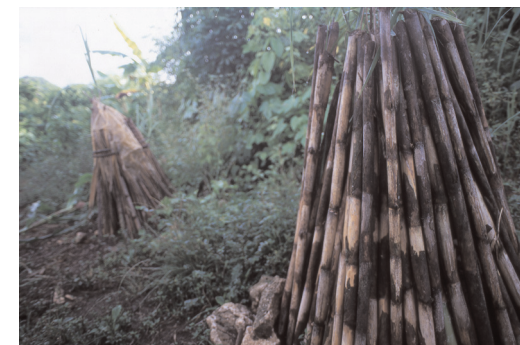
Cubierta envolvente de carrizo.