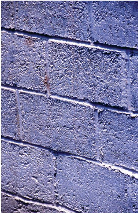
Muro de bloque de cemento