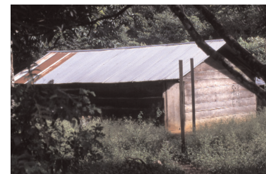
Cubierta con dos pendientes