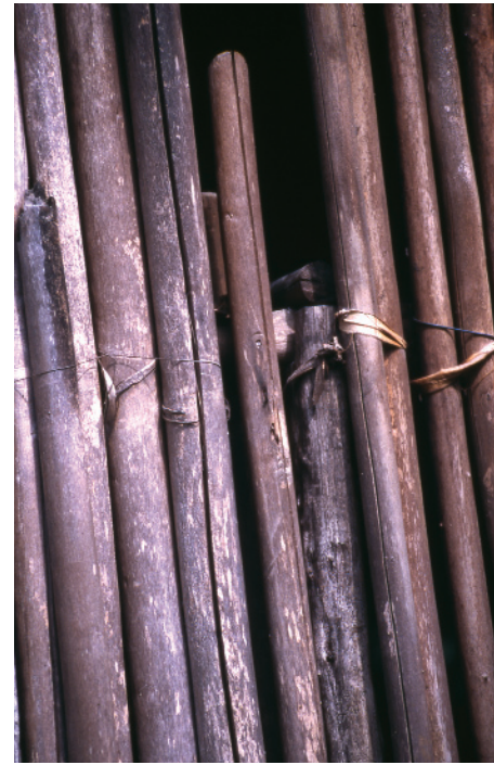
Muro de empalizada de palos rollizos