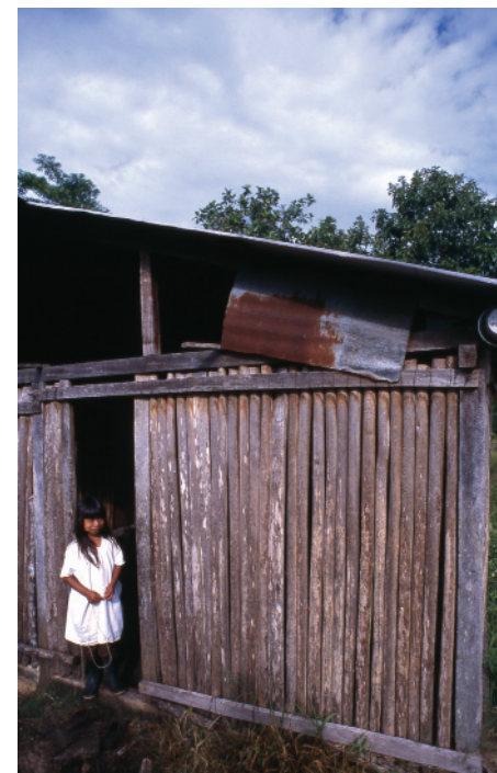
Vigas y horcones de piezas de madera.

A continuación presentamos las Fichas descriptivas y cuantitativas de las viviendas de Metzabok. En ellas para cada una de las casas se describen los habitáculos que la configuran, el tipo de elementos constructivos y los materiales de construcción utilizados para la elaboración de ellos. Así mismo, se incluye la cantidad de cada material utilizado, cuantificado de la forma que hemos descrito en este punto.