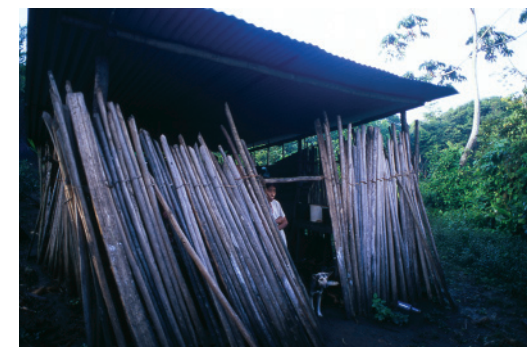
Cubierta a una sola pendiente.

Donde B la base mayor es igual a 12 m., b la base menor es igual a (12 m. ~ 2,4 m. ~ 2,4 m.), es decir 7,2 m. y h es igual a 3,87 m., el resultado final de S en uno de los lados es de 36,86 m 2 y por los dos lados inclinados en forma de trapecio, la superficie es de 73,72 m 2 . La superficie total de lámina galvanizada de la cubierta a cuatro aguas es de 80,44 m 2 . que resulta de la sumatoria de la superficie de los lados triangulares (6,72 m 2 ) más la superficie de los lados trapezoidales (73,72 m 2 ).