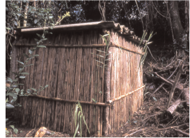
Muros de carrizo.

habitáculo ha sido muy semejante. Las varas de Carrizo están colocadas verticalmente y están alineadas unas a lado de las otras. El diámetro aproximado de estas varas es de 5 centímetros y entre ellas, casi no hay separaciones. Por ello, hemos calculado que en promedio por un metro lineal de este tipo de muro hay 16 varas de Carrizo. Por ejemplo, la troje edificada con carrizo que Mincho Valenzuela tiene en su vivienda (Casa 6), suma 7,2 m. lineales de muro; si por cada metro lineal en promedio hay 16 varas, el total de elementos utilizados en este habitáculo es de 115,2 varas de Carrizo.