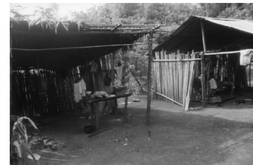
Cubierta de hojas de palma.

Durante los levantamientos arquitectónicos realizamos la cuantificación del número de varas existentes en algunas casas de pollos. Así mismo, en las fotografías hemos verificado el número de varas para las casas de pollos que no se cuantificaron directamente. A partir de estos dato, hemos tomado el promedio, de tal forma que por cada casa de pollo hay 36 varas de Carrizo.