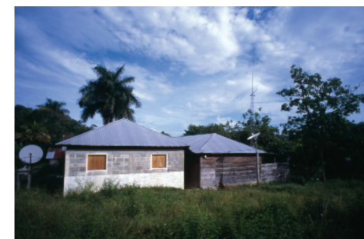
Cubierta con cuatro pendientes