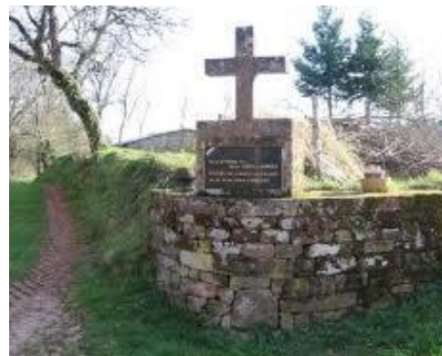
Noilhac. Corrèze. Placa conmemorativa