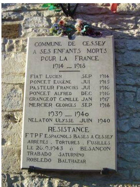
Cessey. Doubs. Placa conmemorativa