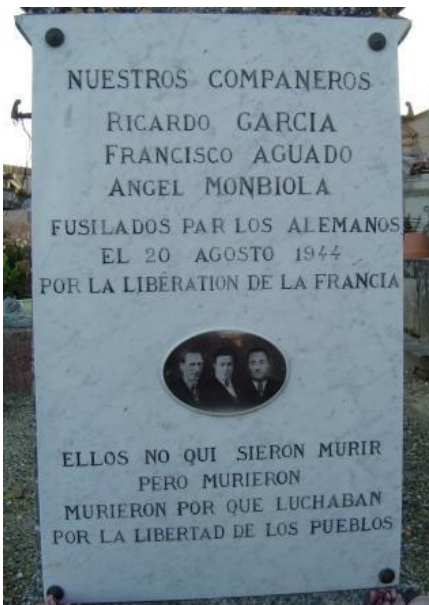
Placa conmemorativa en Ondes