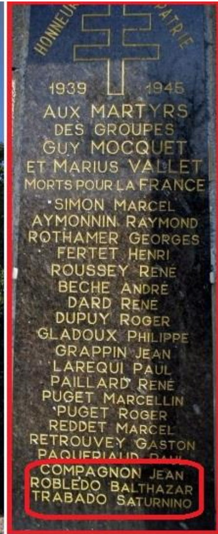
"Rocher de Valmy" cerca de Besançon.