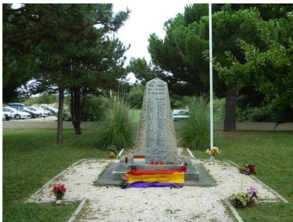
Monumento de homenaje a los republicanos españoles en Argelès (Francia)