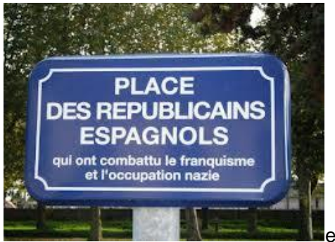
Homenaje a los republicanos españoles en la localidad de Migennes (Francia)