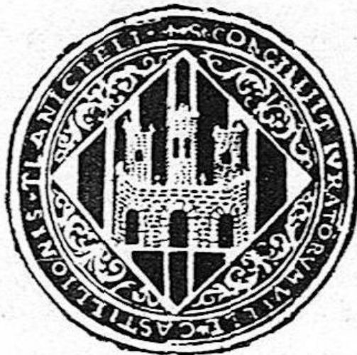
Ilustración 3: Escudo del Consell de Castellón:

En la imagen podemos observar el sello del Consell en el siglo XVII. Imagen extraída del libro de Vicente Traver