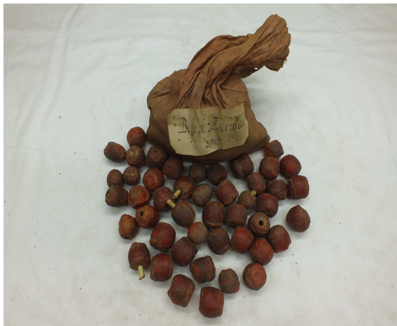
Ilustración 6: Bolsa de escribanos 153 .

Las conclusiones del análisis detallado de todas las insaculaciones nos muestran como no hubo el dominio de ninguna familia en cuanto a miembros puesto que son los Giner, como no, los que más tuvieron pero solo fueron tres, seguido por los Martí y los Bou con dos. Todas las demás solo tuvieron un miembro en esta bolsa, que recordemos tenía el límite establecido en el Privilegio de 1604 en diez.