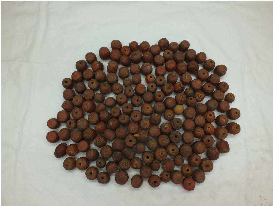
Ilustración 1: Redolines de cera de la insaculación 50 .