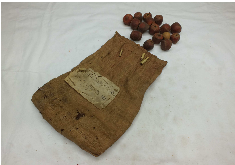
Ilustración 5: Bolsa de jurado tercero y cuarto 147 .