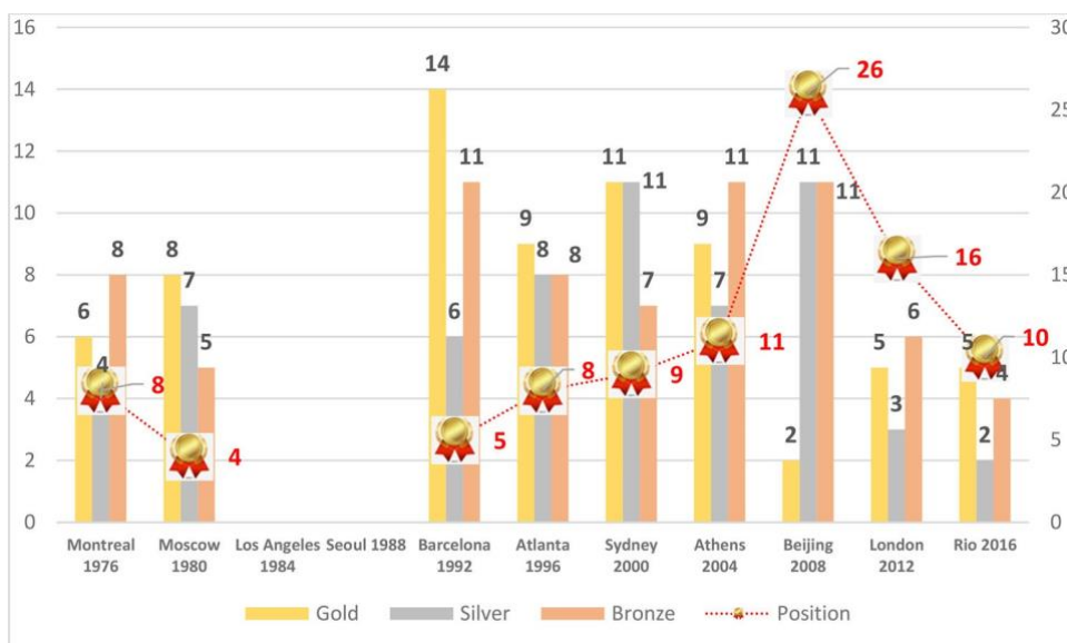
Graph 1. Medals won by Cuba in the Olympic Games between Montreal (1976) and Rio (2016) and final ranking in the medal table.

As far as the gender of the athletes covered is concerned (Table 4), the predominance of news coverage of male athletes stands out (n ¼ 485, 47.74%), compared to the limited attention paid to accomplishments achieved exclusively by female athletes (n ¼ 106, 10.43%). The coverage of both genders played an important role in the agenda (n ¼ 425, 41.83%). It should be noted that none of the articles are written by women.