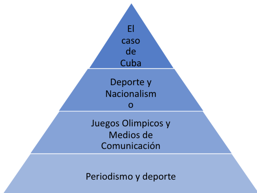
Figura 1. Ejes temáticos.

El estado de la cuestión de la investigación se desarrolla a través de una estructura piramidal (ver figura 1), construida tras una revisión sistemática de la literatura, que se mueve desde el eje temático más amplio hasta el más específico. Los ejes temáticos contemplados son los siguientes: