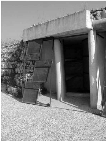
Foto 24: Las criptas familiares hechas en concreto en su interior están recubiertas de un grueso muro de piedra y terreno natural por la parte superior. La evocación a la cueva, a la ladera de la montaña es evidente.

En repetidas ocasiones se ha mencionado la importancia que ha tenido la influencia del 'Land Art' en este proyecto en particular de Miralles y Pinòs, el cual, además de alterar la tierra donde se asienta con un sentido artístico, cumple con su objetivo primordial: explicar nuestra presencia en este mundo. Es decir, se trata de un objetivo tan antiguo que es compartido por diversas construcciones sociales, la religión, el arte o la ciencia, que aparentemente tienen fines distintos, pero en el fondo están mucho más relacionados de lo que parece: "Durante el último siglo la expresión artística [del land art] se ha abierto camino a través de nuevos medios, lenguajes, materiales, significados. La búsqueda de novedad, sin embargo, no aleja al arte de una de sus misiones originales: la reflexión acerca del sentido de la existencia humana y de los mundos de lo visible y lo invisible. Uno de los enigmas que ha inquietado al ser humano desde la antigüedad es su relación con la naturaleza. El arte contemporáneo, a través del Land art, se adentra en esta antigua preocupación humana." 3 [Énfasis propio]. Los arquitectos explotan este camino estético a través de la naturaleza, es decir sobre la transformación del territorio en arquitectura, para combinar la costumbre ancestral del acto funerario como infraestructura social necesaria, con la interpretación estética de esta relación, en simultaneidad.