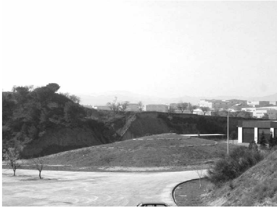
Foto 2: El acceso al cementerio se da a través de un andador que pasa entre dos montículos, y de allí se abre una plazoleta de forma elipsoidal que sirve tanto para peatones como vehículos. Se aprecia el trazo helicoidal sobre uno de los montículos.