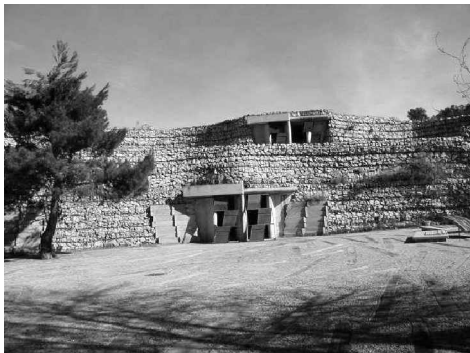
Foto 9: El remate del camino lo constituye esta plaza elipsoidal donde se concentran las criptas familiares. Con un aspecto más primitivo que evoca la cueva como lugar de entierro antiquísimo, sin dejar se lado la iconografía cristiana.

Materiales naturales: prácticamente todos los inmuebles que componen el cementerio están cubiertos por una gruesa capa de tierra con el fin de integrarlo a