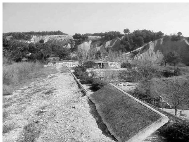
Foto 25: El cementerio parte de la idea de respetar el paisaje existente y sin duda se convierte en parte integral del mismo, sin negar a su carácter artificial.

Valoración simbólica. ¿Qué representa la muerte en la vida de un ser humano? Sería imposible determinar ya no una, sino incluso varias respuestas, ya que las posibilidades son prácticamente infinitas, situación que se da sin duda en el territorio de lo subjetivo, pero aun en lo colectivo, cada sociedad se relaciona a su vez de una manera particular con ella. Sin poder particularizar, es evidente que existen mitos y ritos común tan antiguos como el hombre mismo. Los actos funerarios, los monumentos y tumbas dedicadas a mantener el recuerdo vivo de aquellos que se fueron, está arraigado de una u otra forma en la naturaleza humana.