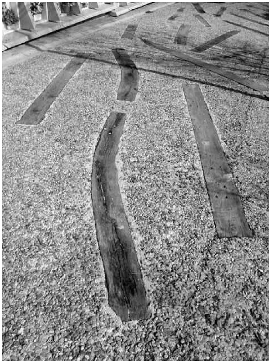
Foto 22: El piso de la calle de los nichos está acabada en dos materiales muy evocativos: los pequeños cantos rodados que recuerdan el lecho de un río; los vigas de madera, que parecen flotar en ese río petrificado. El juego con elementos naturales para conformar una iconografía anclada en creencias tan primitivas como el hombre mismo, sin olvidar las referencias concretas al cristianismo.

De una gran cultura, Miralles sabía hacer que sus referencias a autores, obras, viajes y libros no afloraran literalmente, sino siempre a través de su filtro creativo. Para ello aplicaba el método de inventar continuamente, subvirtiendo toda tipología establecida. Creaba formas de un organicismo mineral, recurría a un método gestual y expresionista, se acercaba al caos y al delirio del movimiento. Miralles supo hacer habitables las esculturas dinámicas y las estructuras abstractas más inverosímiles (Montaner,2000 ).