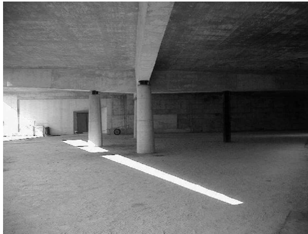
Foto 26: La capilla de servicios fúnebres a pesar de estar inacabada es simbólicamente muy potente: la santísima trinidad en las columnas de concreto, los tres lucernarios, la planta triangular. Otros signos como la cruz, que soporta la cubierta (al mundo), el hombre (columna metálica) que soporta a su vez la cruz. La cueva como lugar para el rito, la luz natural que penetra al interior, la conexión dirigida entre exterior e interior.

Para la cultura occidental y más específicamente la creencia cristiana, los símbolos que representan toda una cosmovisión del mundo, son harto conocidos. Igualada no es la excepción. Justamente es aquí donde el proyecto concentra su fuerza expresiva. Se hacen evidentes varios símbolos conocidos y ya documentados en diversas publicaciones: el monte del calvario, la cruz, la santísima trinidad, el valle de la muerte, el río de la vida.