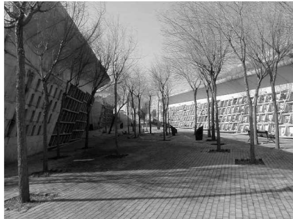
Foto 5 y 6: Vistas de la calle que reúne los nichos mortuorios. El talud al poniente desde ambas perspectivas, cuando se baja y durante el ascenso.