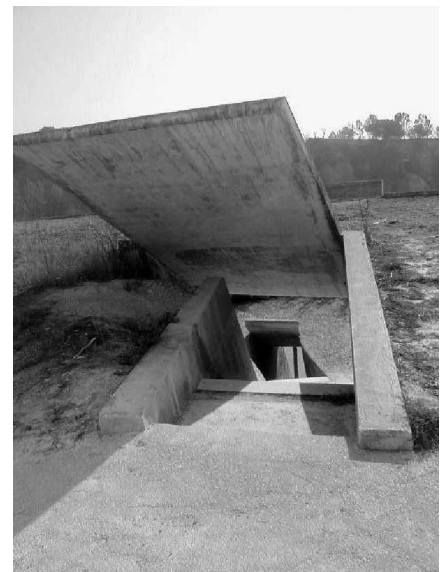
Foto 23: La arquitectura del cementerio juega de manera constante con la metáfora del entierro, del puente entre la vida y la muerte. Aquí la escalera permite el “descenso” o “regreso” a la tierra, a ese lugar original, misterioso y desconocido que inevitablemente queremos conocer.

Una segunda estrategia de los arquitectos es el uso de la metáfora en el proyecto que nos acerca a una lectura espacial de la eterna dialéctica que implican la vida y la muerte, esta realidad que la cultura humana en general ha cargado de sentido en un intento por entender su paso por este mundo, anclado en una sólida creencia de una vida alterna, en un más allá promisorio, en una palabra ese negarse a morir, o en todo caso morir biológicamente, pero nunca en la memoria social. De esta forma se hacen evidentes diversos mitos que el proyecto reinterpreta en su materialización: El valle de los muertos, el río de la vida, la fuente de la vida, el fin del camino.