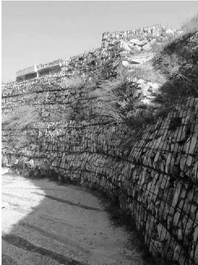
Foto 27: Una proporción importante de los materiales al ser naturales son reciclables, pueden volver al ecosistema. Así mismo la arquitectura contribuye en sus muros de piedra y cubierta vegetal a mantener los ecosistemas para pequeños organismos, disminuyendo su impacto negativo sobre el entorno.

El uso cotidiano del cementerio ayuda en si mismo a la conservación de energía ya que el horario de visita es primordialmente diurno limitando el uso de energía eléctrica al pequeño edificio de servicios y la capilla. El primero aprovecha al máximo la luz natural (cenital), mientras que la capilla por ahora continua inconclusa. Aun así es importante destacar el bajo consumo energético que tiene el cementerio en general: mantenimiento mínimo para retener su aspecto casi intacto, que al retomar la vegetación silvestre que cubre techos, muros y pisos de piedra, así como el concreto aparente, facilita esta tarea.