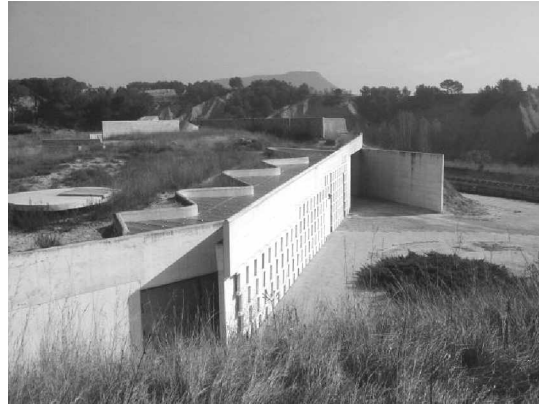
Foto 3: En primer plano el edificio de servicios con su fachada de concreto ciega y el lucernario ondulado para incorporar luz natural al interior. Al fondo se aprecia el acceso a la capilla. Ambos edificios están cubiertos por una capa vegetal, literalmente 'entrados'.

Por el contrario hacia el sur y el poniente el cementerio colinda con la zona industrial que ha urbanizado una gran extensión del terreno que no hace tanto tiempo se destinaba al cultivo. En este contexto se definen una serie de edificios de corte fabril, grandes galerones cubiertos, edificados con materiales prefabricados de concreto o acero.