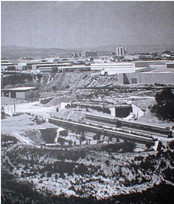
Foto 1: Vista aérea del conjunto. En primer plano el cementerio en proceso de construcción, enmarcado por el polígono industria. Al fondo se aprecian algunos edificios del centro urbano de Igualada. Se trata de un paisaje heterogéneo y desde este ángulo la expansión urbana se hace más que evidente.

El concurso fue ganado por el equipo formado por Carmen Pinòs y Enric Miralles en 1985. Sin embargo el proceso para desarrollar el proyecto ejecutivo y la obra ha