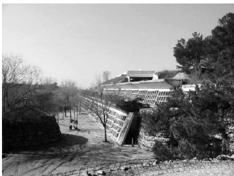
Foto 10: Esta vista desde el extremo sur del conjunto permite apreciar los niveles del cementerio: la calle de nichos más baja, un nivel intermedio con nichos de un solo costado y en alto (el nivel de los vivos) se vislumbra el acceso posterior a la capilla. Nuevamente se hace evidente esa intención de 'enterrar' tanto el edificio como a sus usuarios, de manera real y metafórica respectivamente.