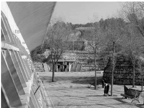
Foto 17: El espacio confina al visitante, aislándolo visualmente del entorno industrial, creando un ambiente de confinamiento, de concentración en el lugar mismo y su naturaleza: un sitio de reflexión metafísico, para convivir, mediante el recuerdo, con los que ya no están.

Cuando se inicia el recorrido a la zona de tumbas, los muros laterales de concreto macizo, que definen el perfil del espacio, apenas marcan su presencia. Al lado