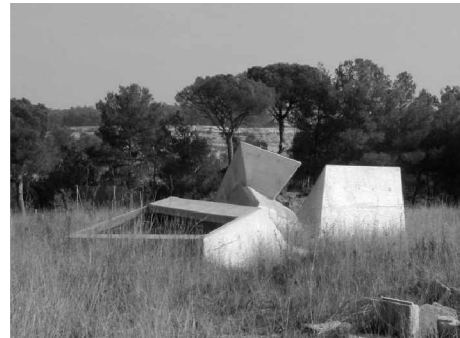
Foto 15 y 16: A la derecha el techo de la capilla, totalmente enterrada, apenas unos lucernarios de geometría caprichosa denotan su carácter de artificio. En ambas se aprecia como el edificio se funde con el paisaje, casi desapareciendo, lo que en el tiempo, con el crecimiento de árboles y hierba se verá enfatizado.