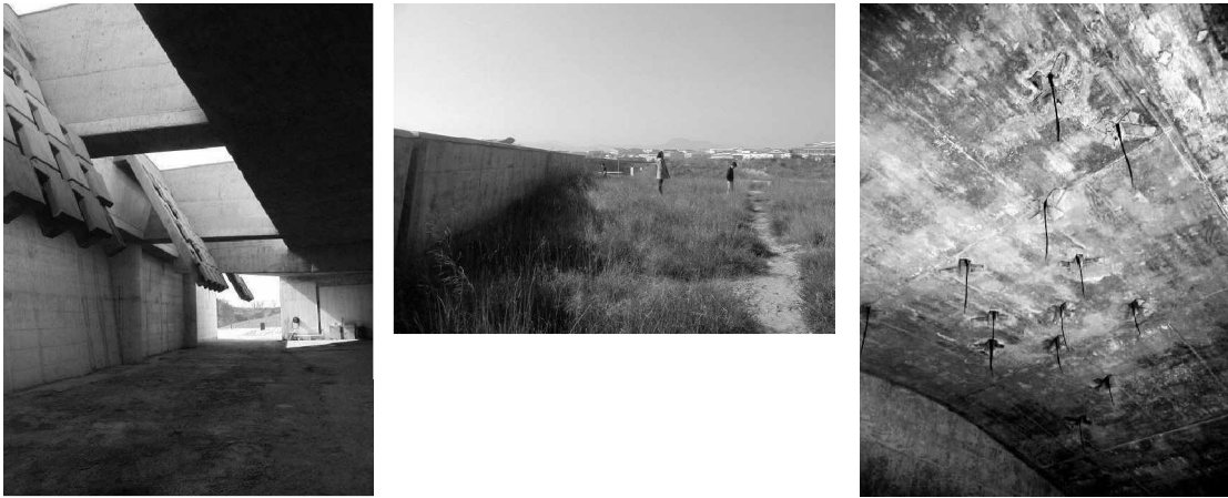
Foto 18, 19, 20, 21: La capilla para servicios fúnebres se transforma en espacio exterior, en parte del paisaje. Al interior diversos signos de la iconografía cristiana se hacen presente: la enorme cruz que soporta la cubierta, a la tierra misma, la planta triangula en clara referencia a la santísima trinidad. El control de la luz, dejándola entrar de manera puntual dramatiza el espacio, donde la penumbra juega un papel fundamental.

derecho un doble muro que forma un pasillo lateral que no lleva a ninguna parte, comienza con esos signos ambiguos que encontraremos durante todo el recorrido en diferentes versiones. Conforme se baja, los muros se elevan manifestando toda la dimensión que unos pasos más arriba apenas se insinuaban, una cañada artificial se ha conformado. Sin duda esa sensación tan repetida de bajar a una tumba, de estar penetrando en la tierra, entrar a un espacio sagrado, se percibe con toda claridad. Los muros contienen ahora un sin número de nichos mortuorios, todo lo demás del conjunto desaparece, solo esta la suelo, los nichos y el cielo, súbitamente hemos sido transportados a otro lugar, al valle de los muertos.