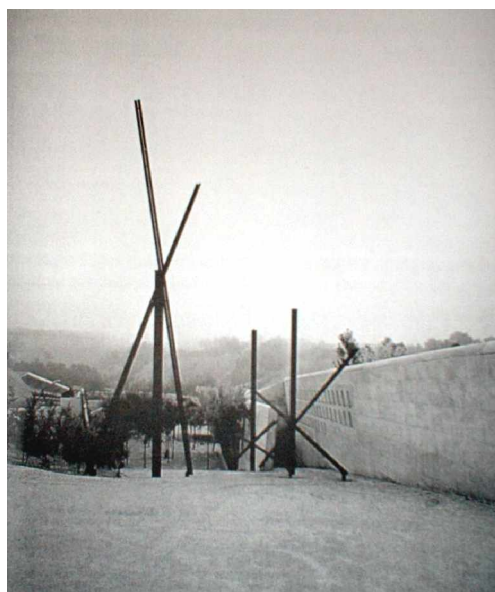
Foto 4: El acceso a la zona de tumbas está enfatizada con una serie de elementos escultóricos de alto contenido simbólico, la cruz, el calvario, el descenso a la tierra. Un doble muro de concreto al lado derecho contribuye a la ambigüedad del lugar, acceso indirecto, puente de conexión entre dos mundos.

La zona de tumbas. Ocupa evidentemente la mayor parte del terreno y en el proyecto es más extenso (dos calles de nichos y no solo una), y que por el momento no se ha realizado la segunda de ellas. Desde la explanada de acceso principal, justo al centro de esta, inicia una calle con pendiente descendiente conformada por dos grandes taludes laterales de concreto que contienen los nichos mortuorios. El acceso de la calle está marcado por dos elementos importantes.