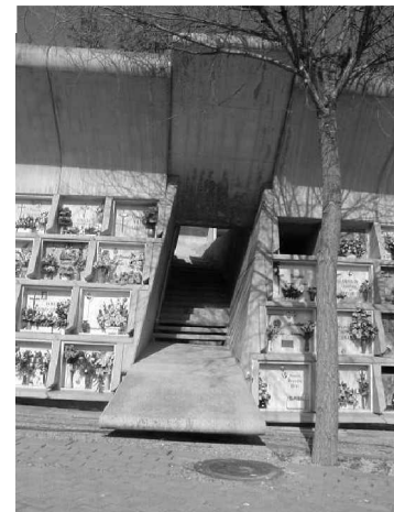
Foto 11,12,13 y 14: Las escaleras que comunican los diferentes niveles del cementerio están cargados de diversos signos; la tumba violada, el descenso a la tierra, el regreso a la vida, la resurrección, el puente entre la vida y al muerte. Sin duda es uno de los puntos más dramáticos de todo el recorrido que evoca a la naturaleza en su concepción más amplia, a la existencia misma.