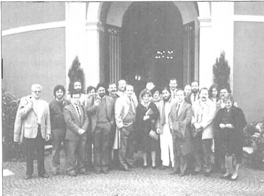
Roma, noviembre 1983.

Entre el 16 y el 18 de noviembre de 1985