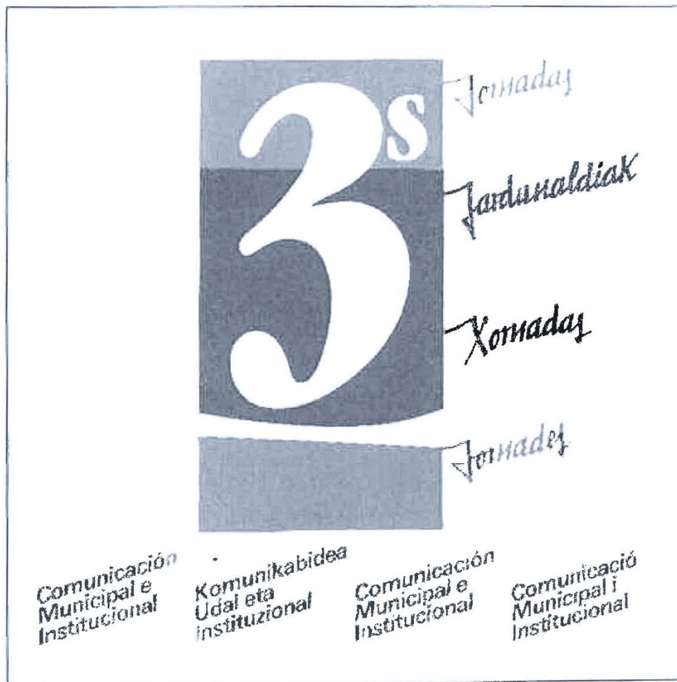
Fulletó de les III Jornades de L'ACIAL, Sitges, 1983