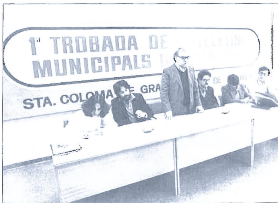
Santa Coloma de Gramanet, febrer 1982.

En fecha 28 de mayo de 1982 se reunía con carácter de urgencia la Junta Directiva de la ACIAL, emitiendo una nota de prensa condenando el cierre de la Televisión Local de Badalona y la detención de su alcalde y cuatro concejales ordenada por Jorge Fernández Díaz, Gobernador Civil de Barcelona.