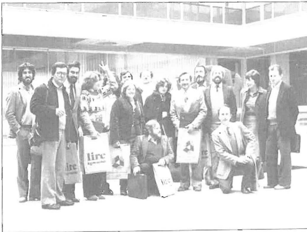
Grenoble, novembre 1982.

Entre el 1 y 6 de noviembre de 1982, los miembros de la Asociación Catalana de Informadores de la Administración Local, con el apoyo económico de la Diputación de Barcelona, organizan, participando un total de 16 inscritos, un viaje a Francia para asistir al Curso de Comunicación Municipal e Institucional en las ciudades de Grenoble, Moltreal, París, Toulouse y Blagnac 83 .