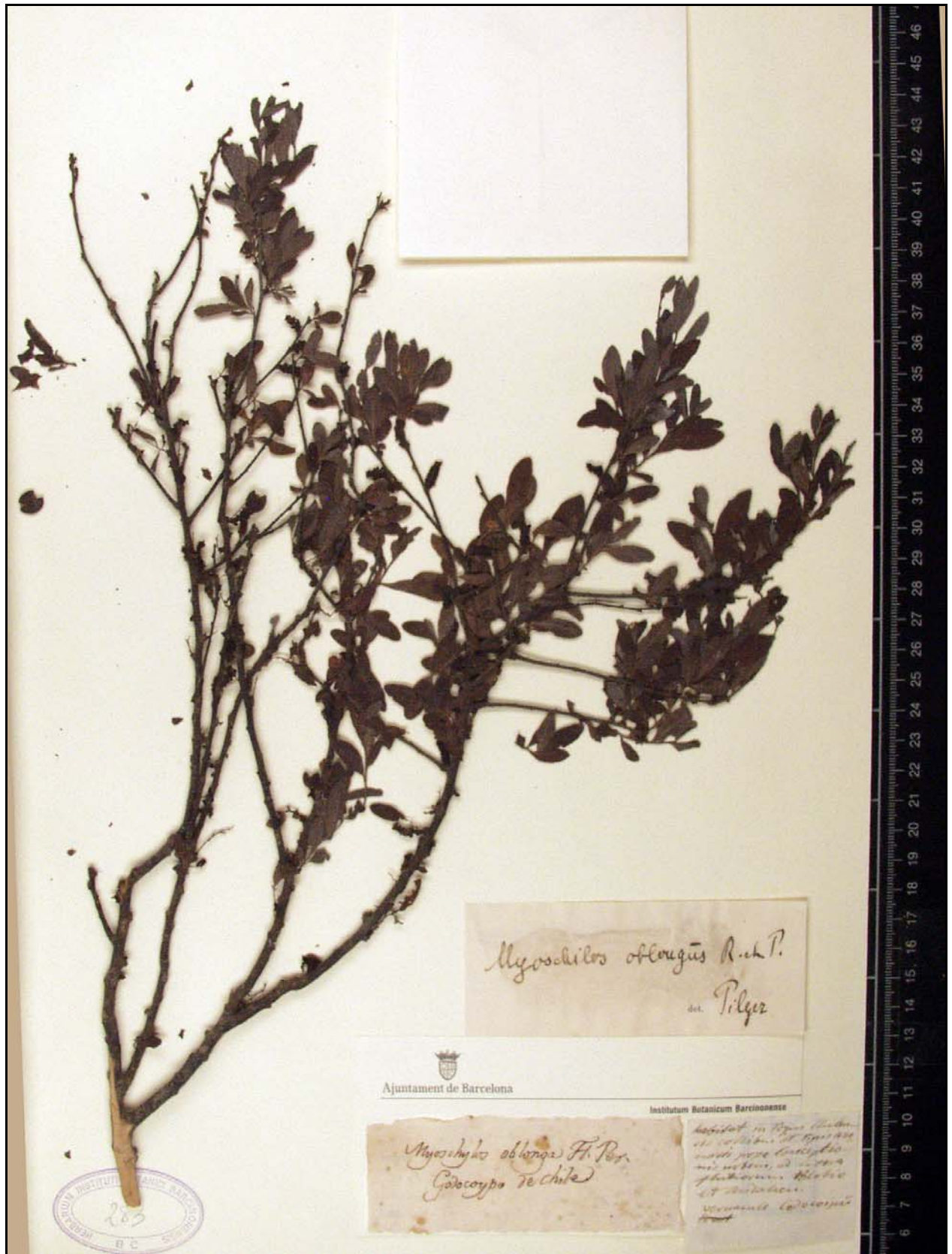
Figura 30. Plec de Myoschilos oblongus Ruiz & Pav. (BC-Ruiz & Pavón-283)