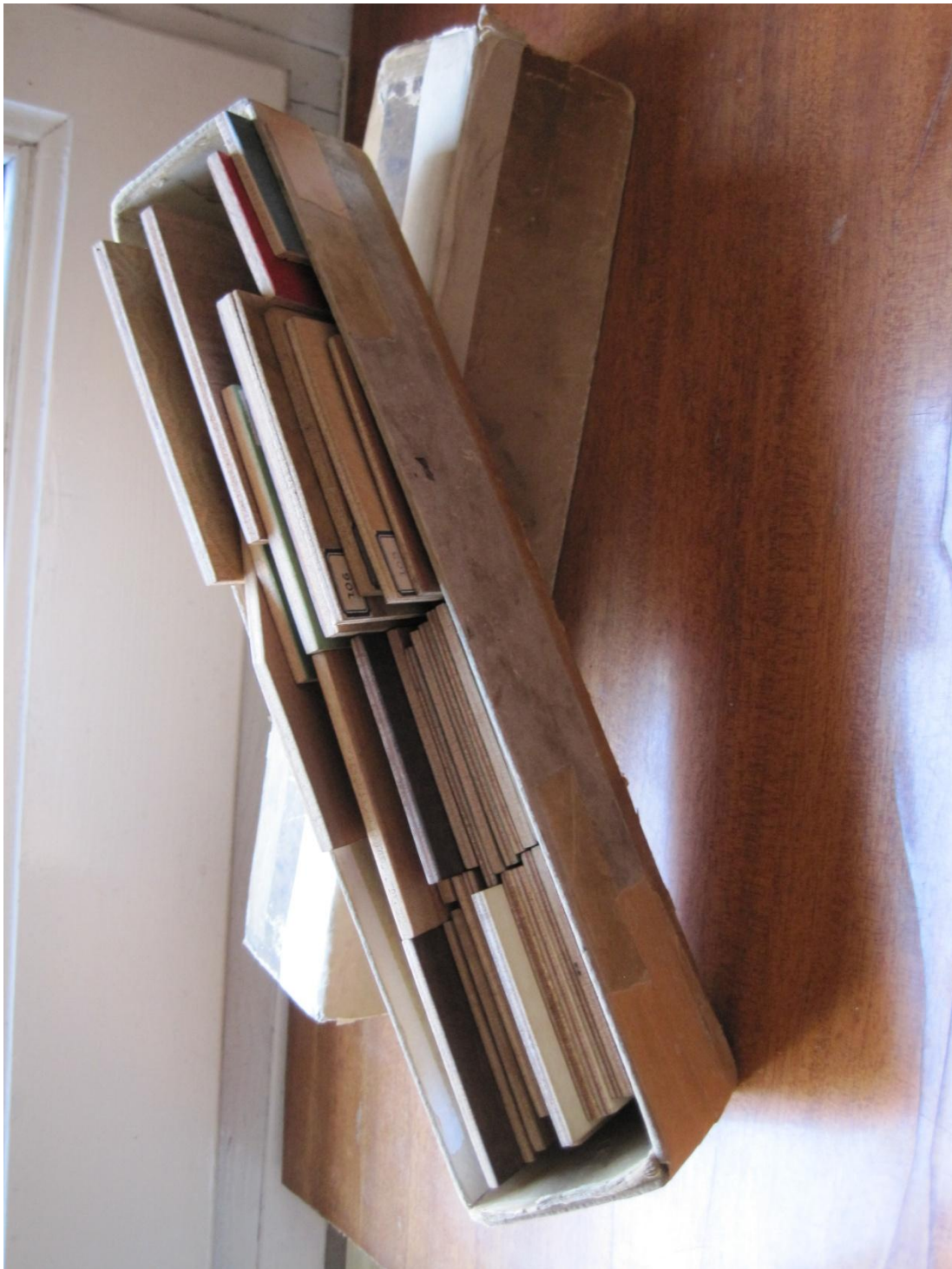
7 Capsa n. 2 del mostrari de xapes de l'Arxiu Sagarra