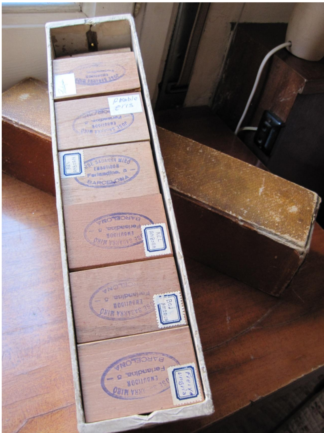
1 Capsa n. 1 del mostrari de xapes de l'Arxiu Sagarra